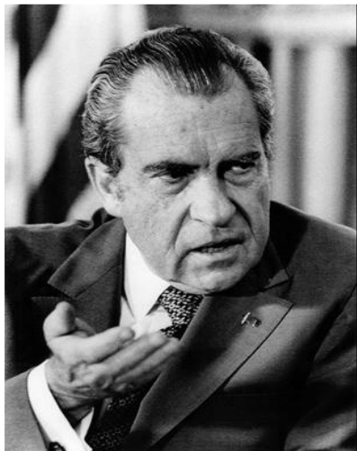
Президент США. Ричард Никсон.

в 1971 г. отказался от обмена долларов на золото по фиксированному курсу