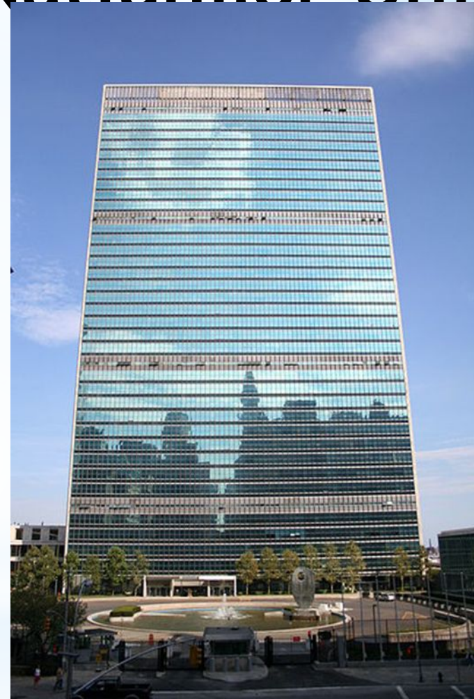
Sediul ONU din New York