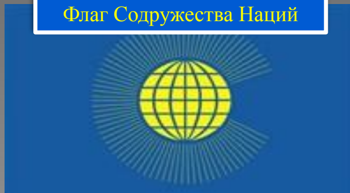
Флаг Содружества Наций