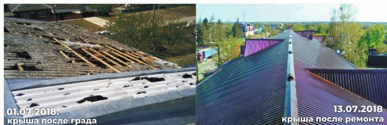
Тимашевский район, ст. Новокорсунская, ул. Красная, д. 31 и д. 35. Крыши побиты в результате града.

В случае повреждения общего имущества в многоквартирном доме в результате аварии, опасного природного явления, катастрофы, стихийного или иного бедствия капитальный ремонт, согласно приказу министерства топливно-энергетического комплекса и жилищно-коммунального хозяйства Краснодарского края от 27.09.2017 № 300 «Об утверждении Порядка принятия решения о проведении капитального ремонта общего имущества собственников помещений в многоквартирных домах в случае возникновения аварии, иных чрезвычайных ситуаций природного или техногенного характера», проводится незамедлительно, в особом порядке - без включения в краткосрочный план.