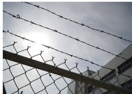
Украине следует провести реформу системы пересмотра пожизненных