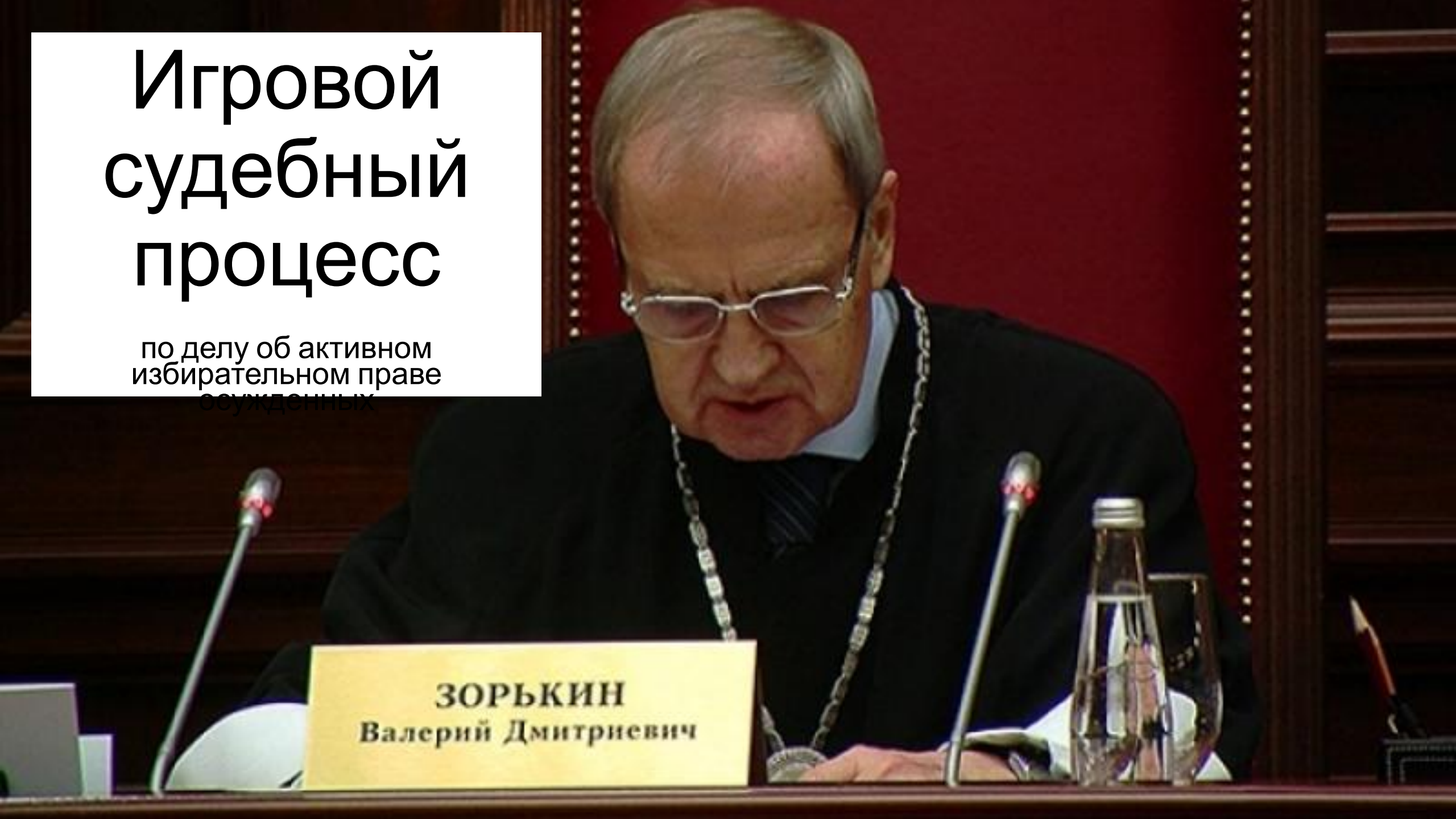
ЗОРЬКИН Валерий Дмитриевич

по делу об активном избирательном праве осужденных