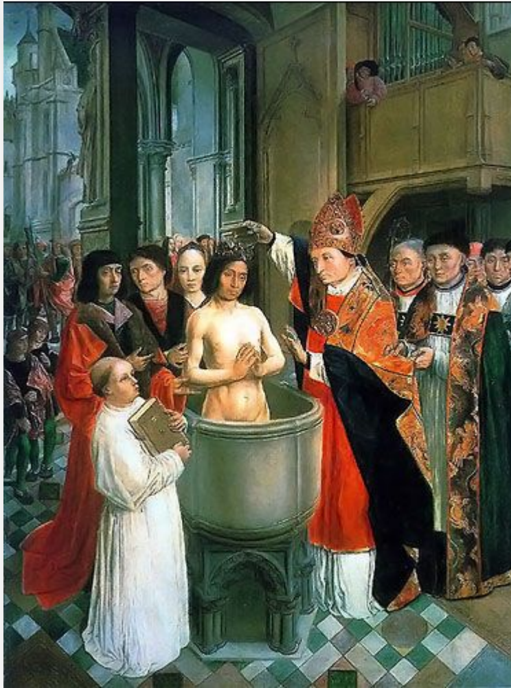
Крещение Хлодвига (около 498 г.)