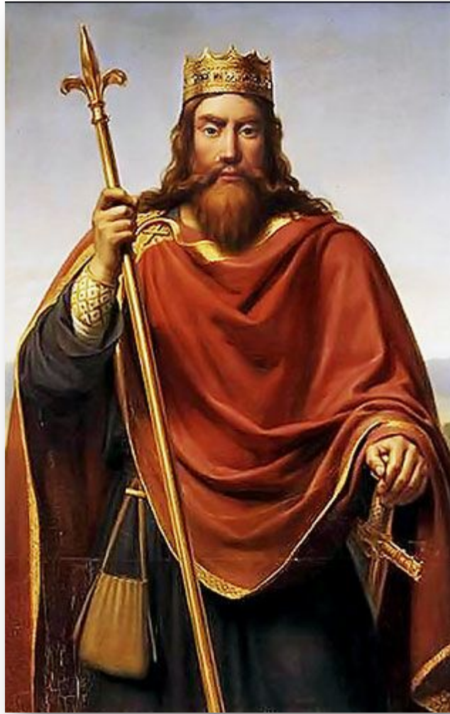
Византийский император Анастасий прислал Хлодвигу пурпурную мантию и диадему – знаки императорской власти