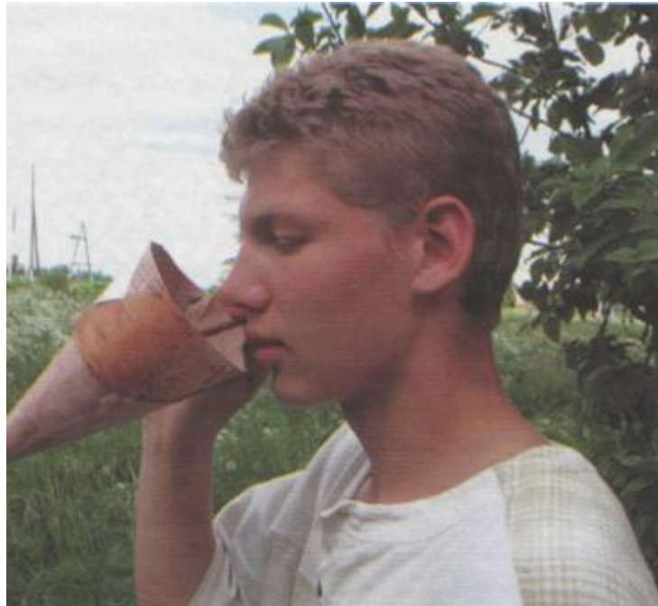
Емкость для питья воды (чипльӧг)

Легкая, красивая, эластичная, водонепроницаемая, она была незаменима в крестьянском быту. Из нее делали разнообразную утварь, посуду и обувь. Бересту для зимних работ хранили в холодном помещении, непосредственно перед работой запаривали в воде.