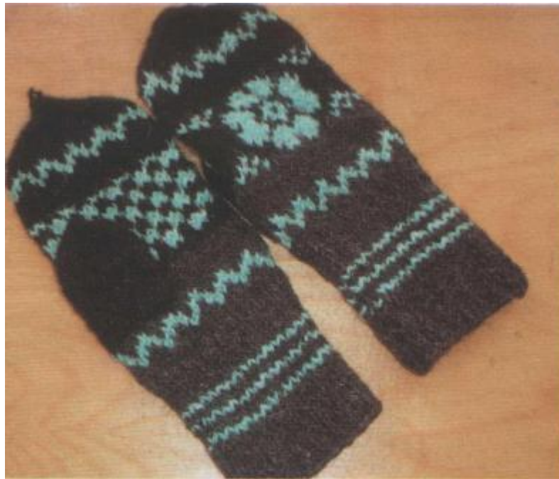
Вязаные изделия прилузских мастериц. Рукавицы

Вязание является одним из традиционных женских занятий народа коми, в т.ч. и жителей Прилузья. Широкое распространение вязания определялось практической необходимостью. Холодные природные условия требовали теплых вещей.