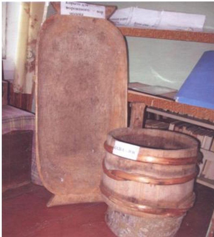
Корыто (вор) и кадка из дерева (öти пеля лок)