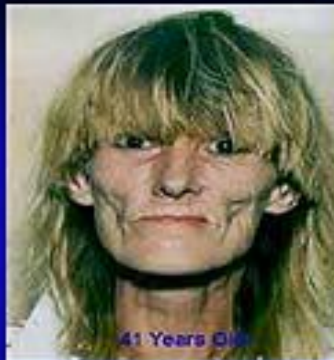
41 Years Old

BEFORE AND AFTER, VISUAL EVIDENCE OF CRONIC METH USE OVER A TEN YEAR PERIOD !