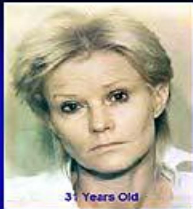
31 Years Old