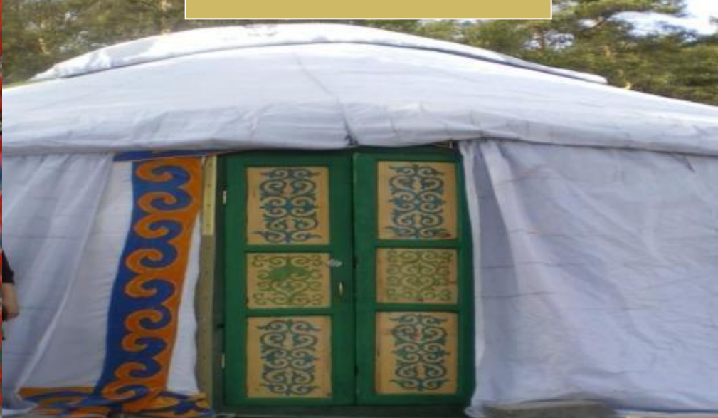
Есік немесе сықырлауық