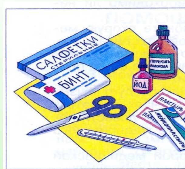
Набор аптечки первой помощи

При получении травмы учащийся должен немедленно обратиться к педагогу.