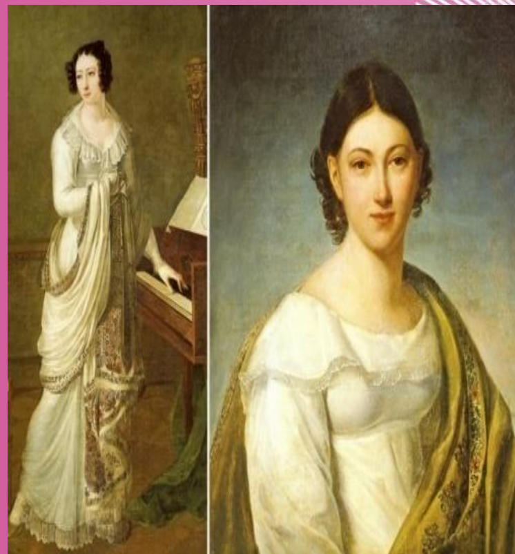
Жозефина - жена Наполеона бонапарта