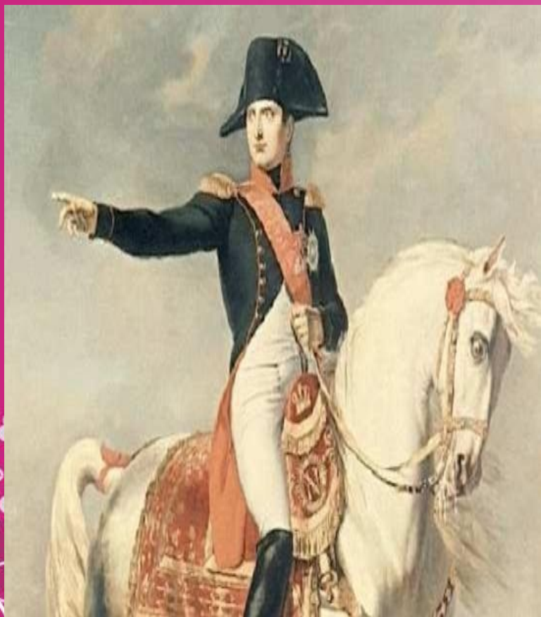
Наполеон Бонапарт – французский полководец