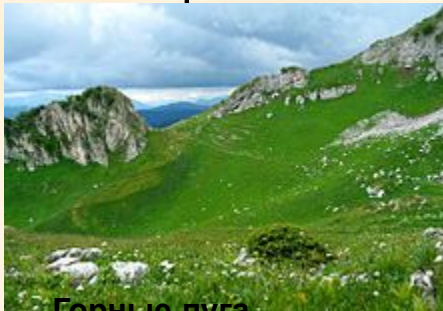
Горные луга, Апшеронский район