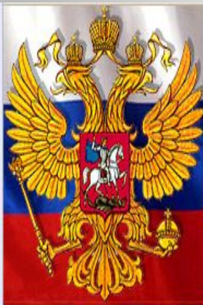
Конституция Российской Федерации.