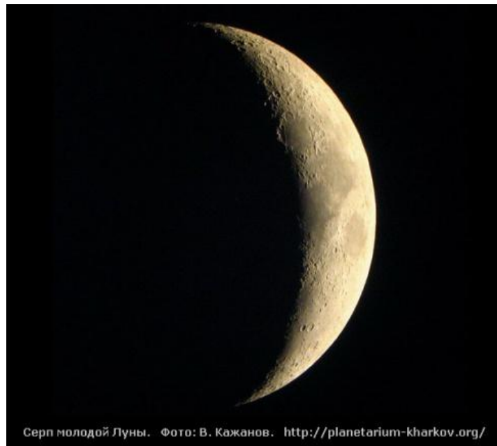
Серп молодой Луны.