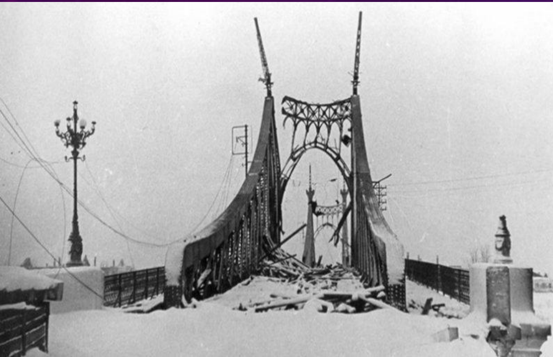
Разрушенный Староволжский мост

В октябре 1941 года советские войска, отступая из Твери, были вынуждены взорвать мост, чтобы затруднить противнику переправу через Волгу. Сразу же после освобождения Калинин от немцев началось его восстановление. К 1947 году мост через Волгу был восстановлен полностью.