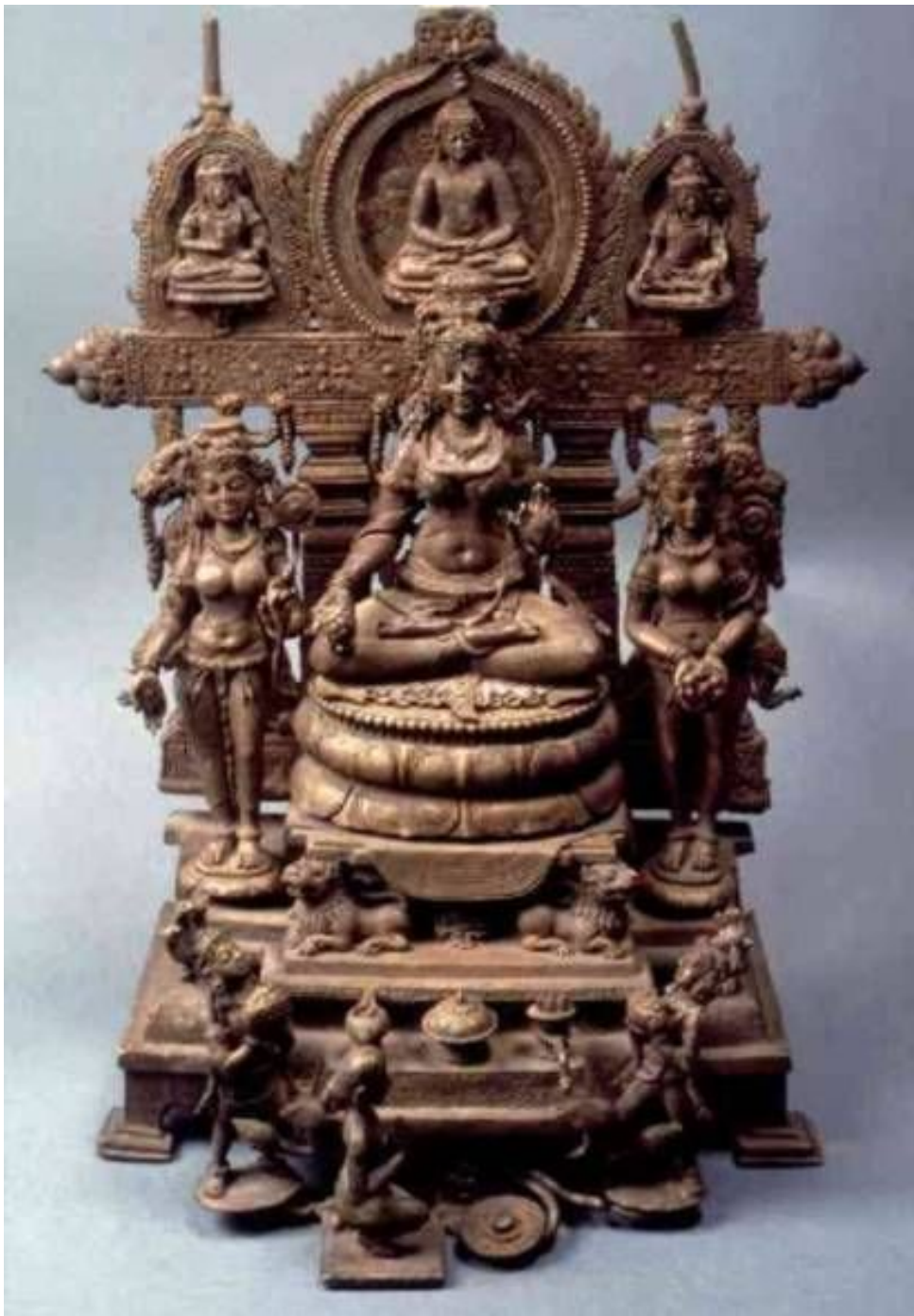
Алтарь из Сирпура . Около 800. Фрагмент Бронза, инкрустация серебром и медью. Высота 38,1 см Музей искусства, Лос- Анджелес