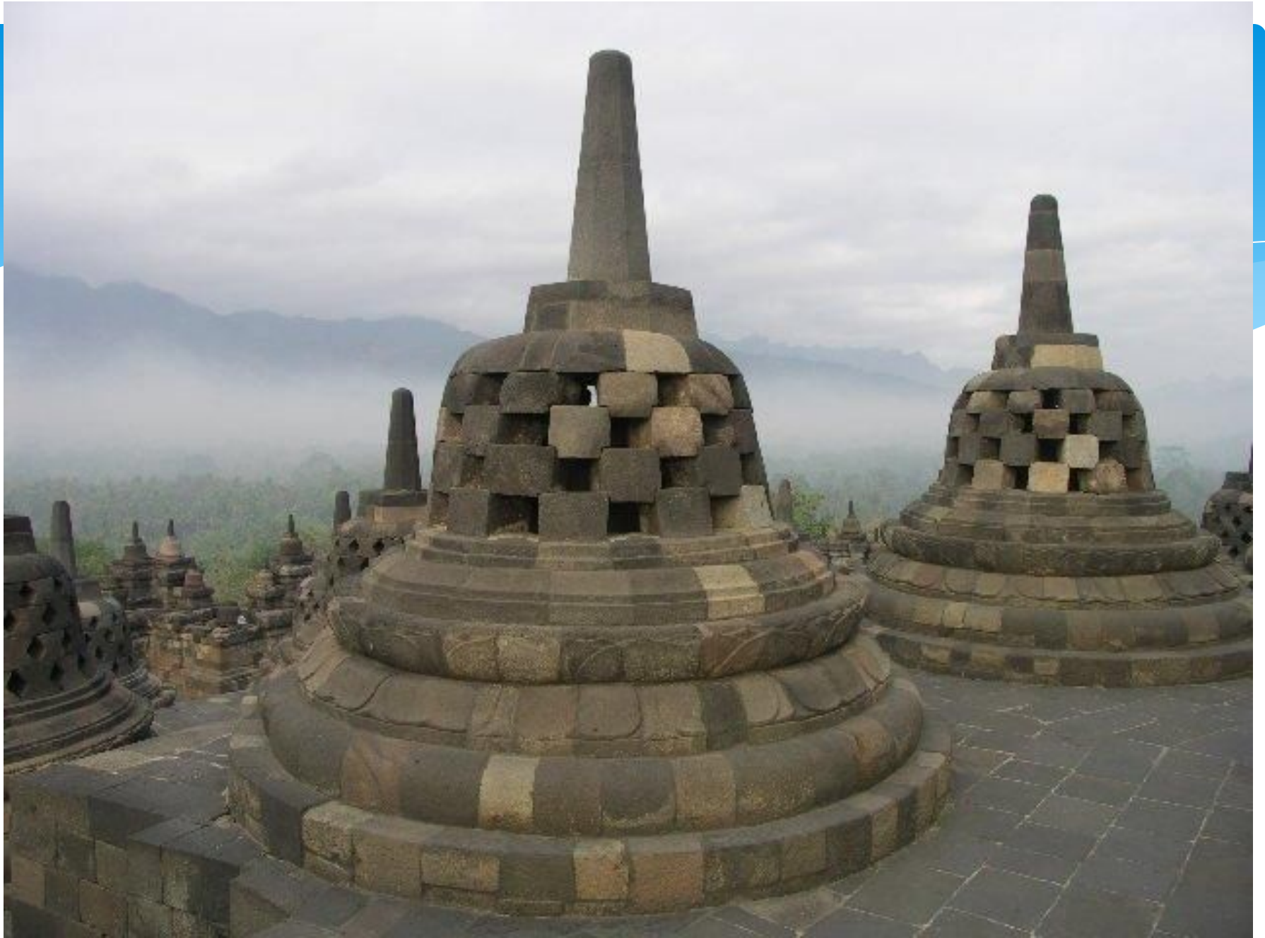
Борободур. Ступы . Конец VIII — начало IX вв. Ява, Индонезия