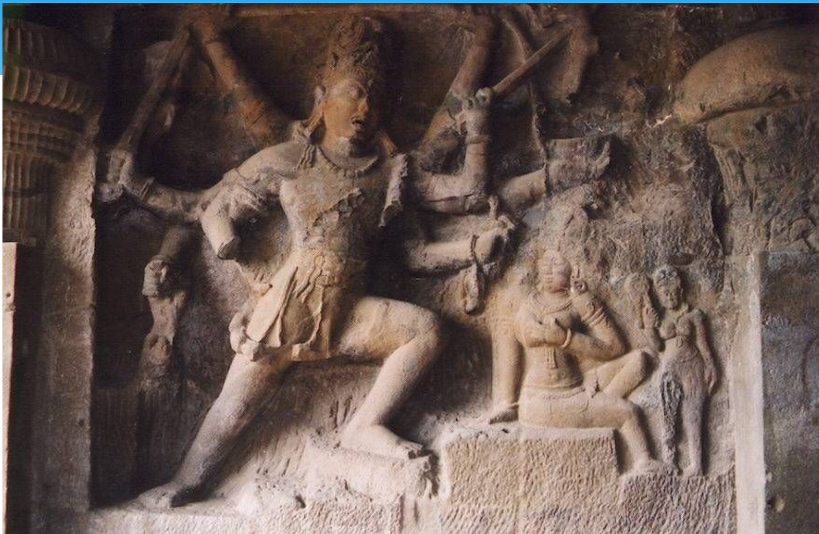
Рельеф из пещерного храма в Эллоре. VIII—X вв. Эллора, Индия

Храмовые комплексы Эллары (VI—X вв.) известны стенными барельефными композициями с изображениями буддийских и брахманских богов и мифологических героев. По сравнению с каноническими фигурами Будды, для которых стали характерны застылость и сухость форм, изображения брахманских богов — пластически сочные, исполненные напряженной динамики.