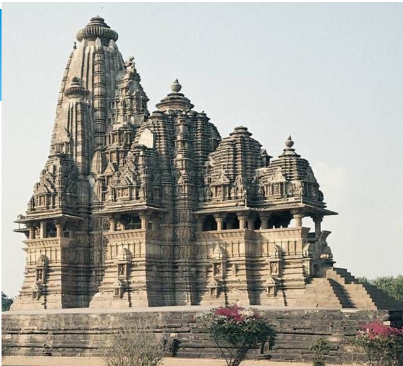
Храм Кандарья Махадева в Кхаджурахо . X—XI вв. Кхаджурахо, Индия