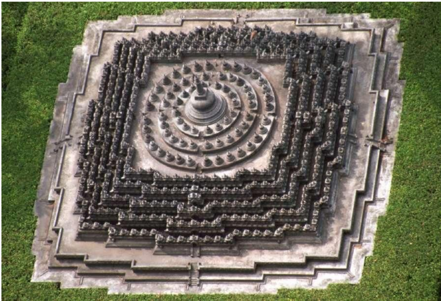
Борободур . Конец VIII — начало IX вв. Ява, Индонезия