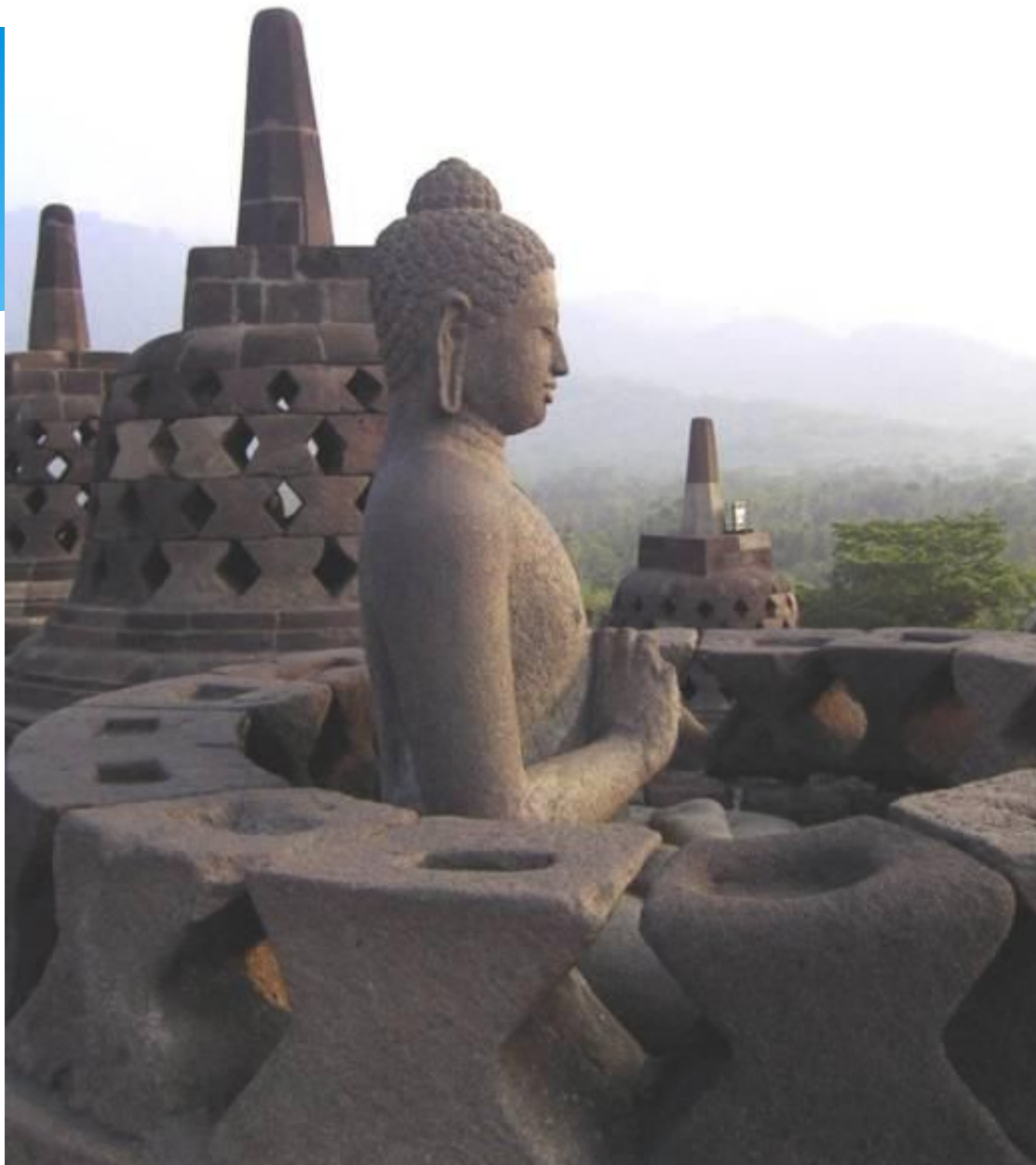
Борободур. Статуя Будды . Конец VIII — начало IX вв. Ява, Индонезия