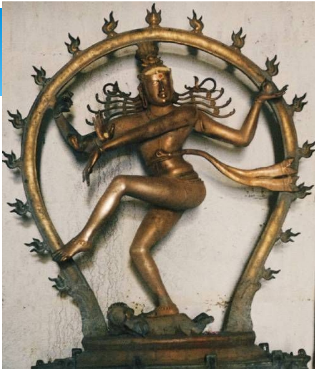
Шива Натараджа . Около 1000 . Бронза.