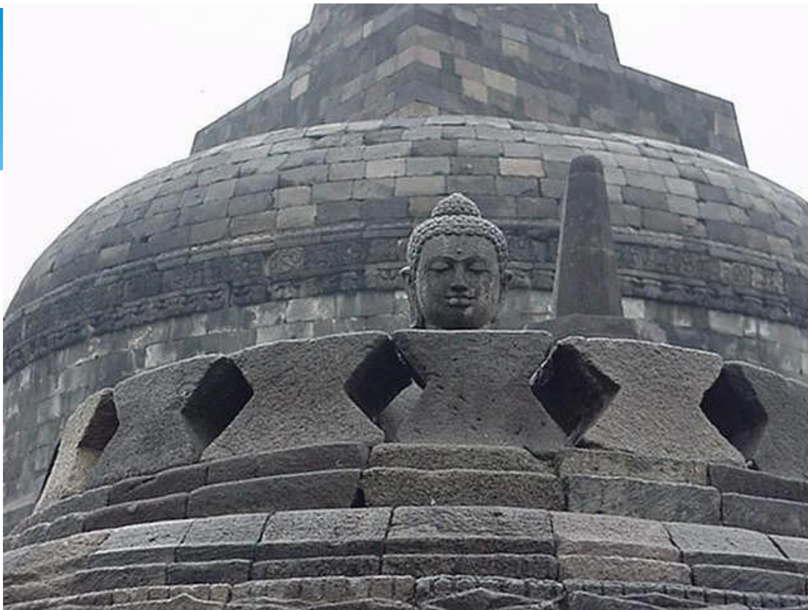
Борободур. Ступа . Конец VIII — начало IX вв. Ява, Индонезия