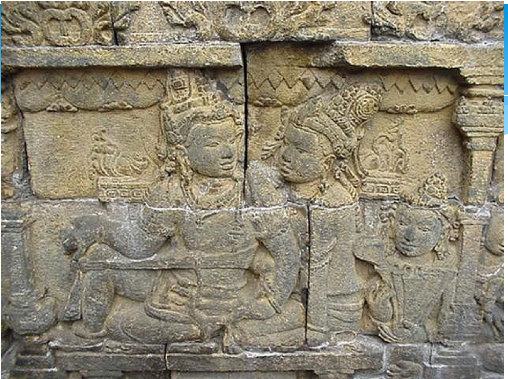
Борободур. Рельеф . Конец VIII — начало IX вв. Ява, Индонезия