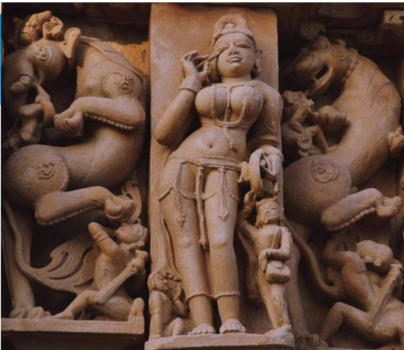
Женщина, крашащая глаза. Скульптура храма в Кхаджурахо . X—XI вв. Кхаджурахо, Индия