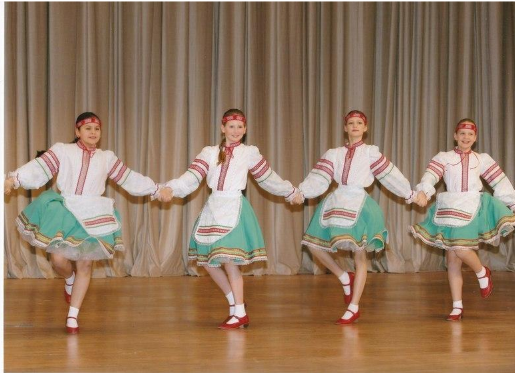
Полька с каблучка