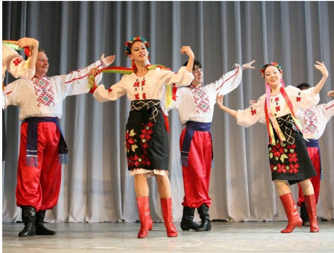
Полька - бабочка