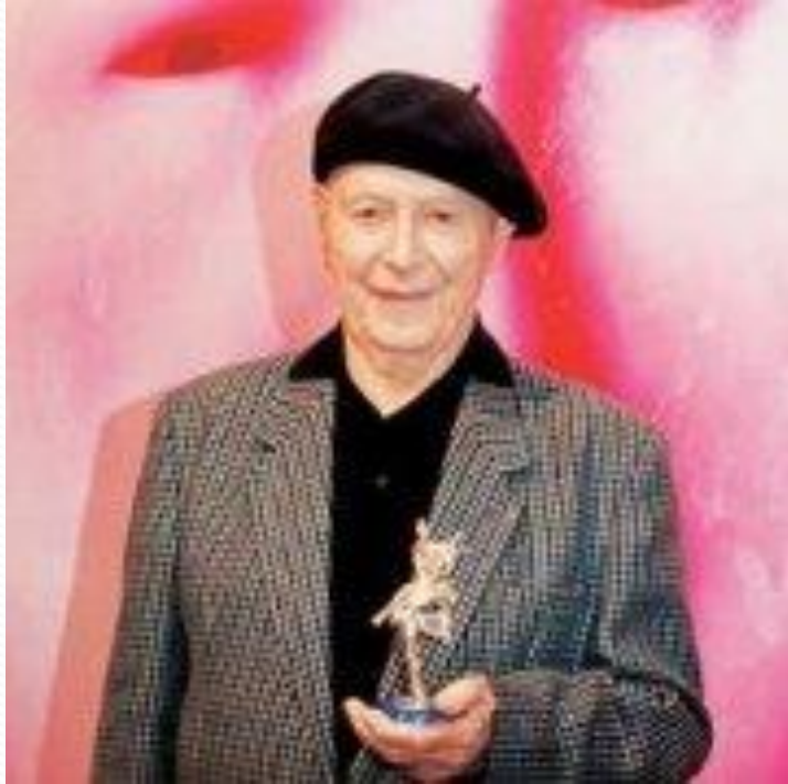
Игорь Моисеев (хореограф, балетмейстер, артист балета)

«Я не вижу более праздничного, жизнелюбивого вида искусства, чем народный танец. Он с детской непосредственностью раскрывает свои чувства, вовлекает в свое веселье...»