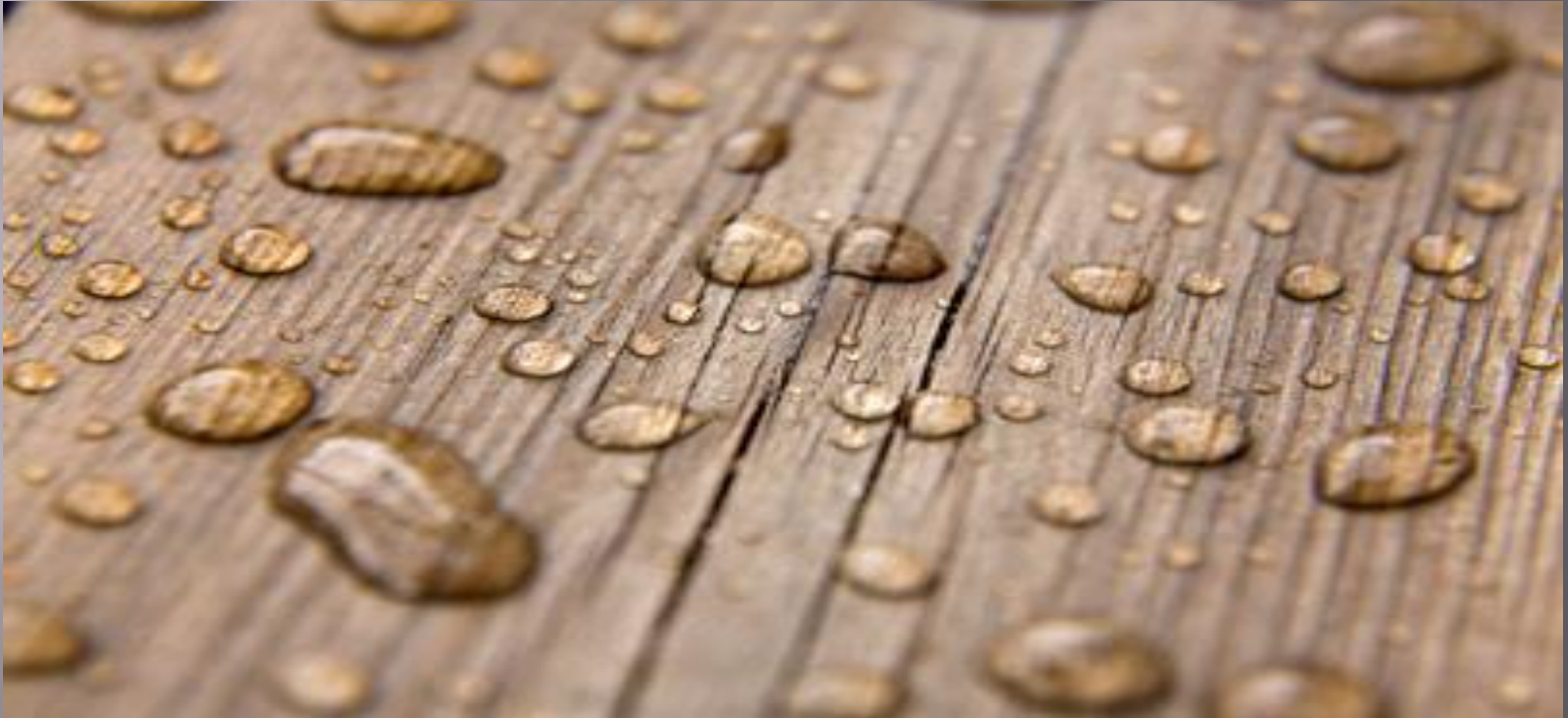
Рисунок 1. Выделение влаги из древесины

Влажность - одна из основных характеристик древесины.