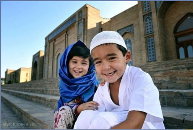
Күлімсіреу - сунна