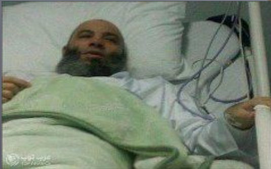
Науқастың халін сұрау - сунна