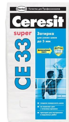
Затирка «Ceresit CE33»