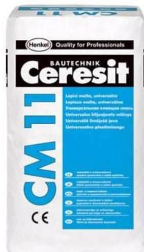
Клей «Ceresit CM11»