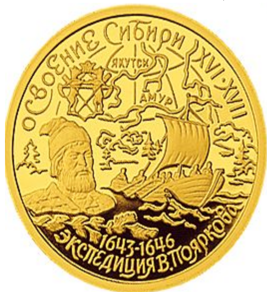
Экспедиция Пояркова (1643–1646) © Васильева Е.А.