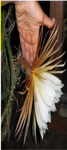
Фото слева: Вид на этот замечательный цветок сбоку, размер – 28 см (29 июня 2003 года, 2 часа ночи). Его аромат, как я обнаружил, исходит из желтой зоны между коричневыми чашелистиками и белыми лепестками.

На фотографии справа цветок совсем не ослепительно белый, а кремовый. Но это не естественный его цвет, просто освещение ночью искусственное, вот и дает оно желтый оттенок на фотографии.