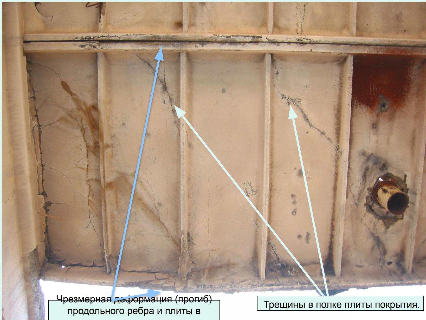
Чрезмерная деформация (прогиб) продольного ребра и плиты в целом