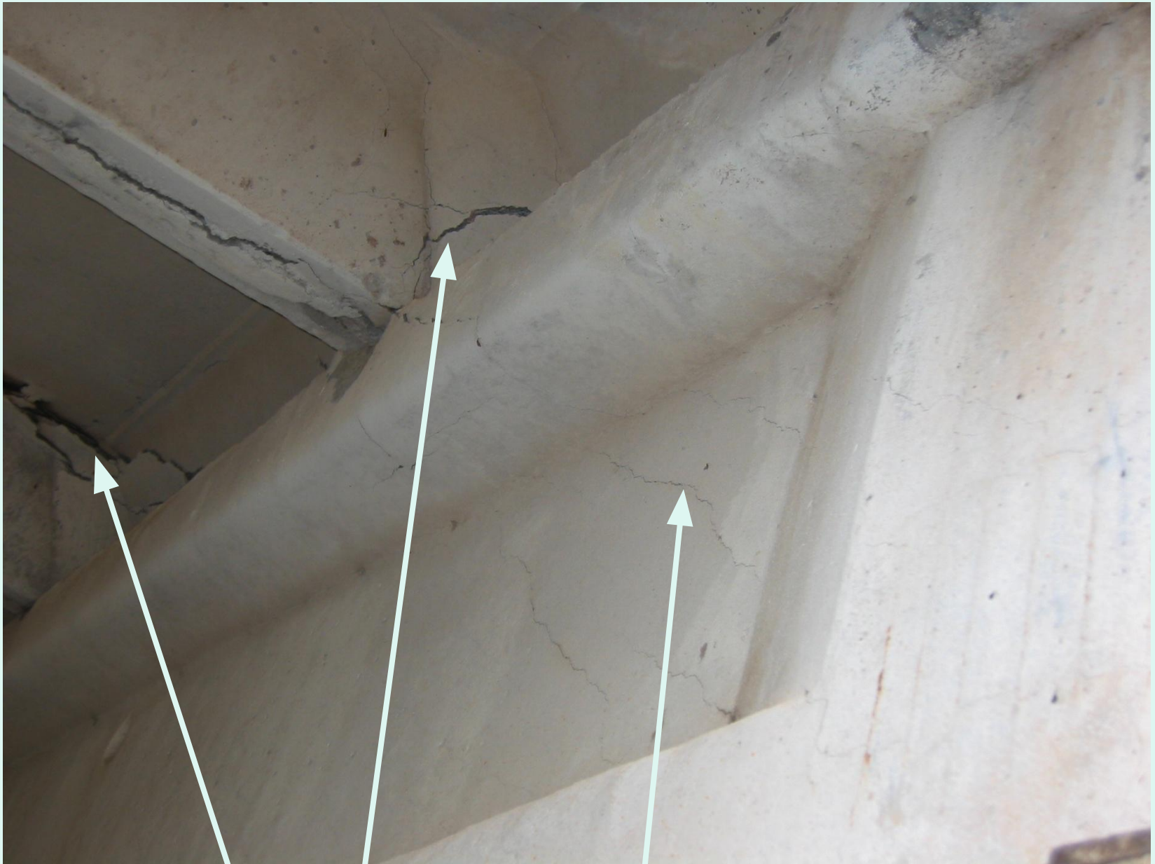
Трещины в конструктивных элементах плиты покрытия