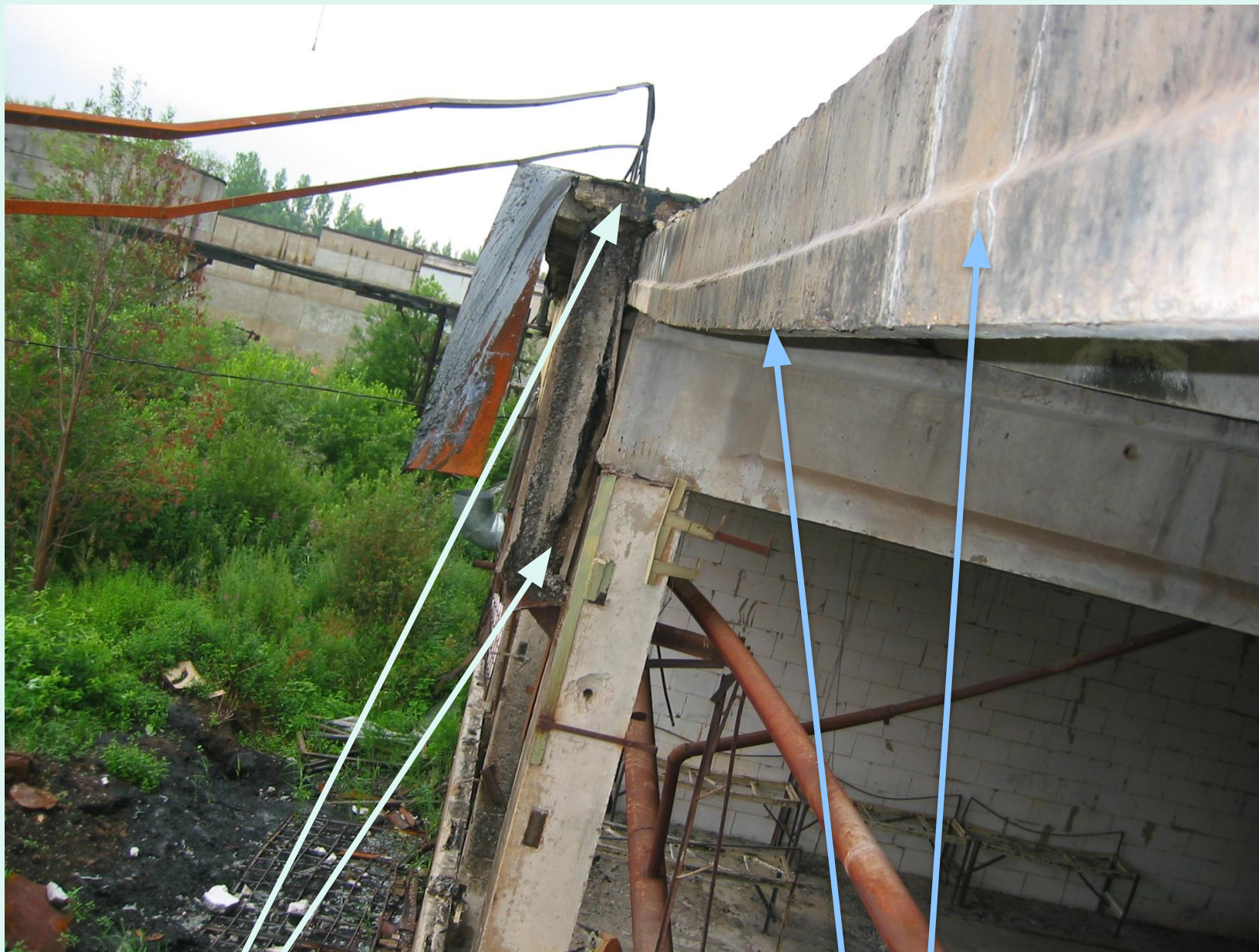
Обрушение карнизных плит. Обрушение стеновых панелей