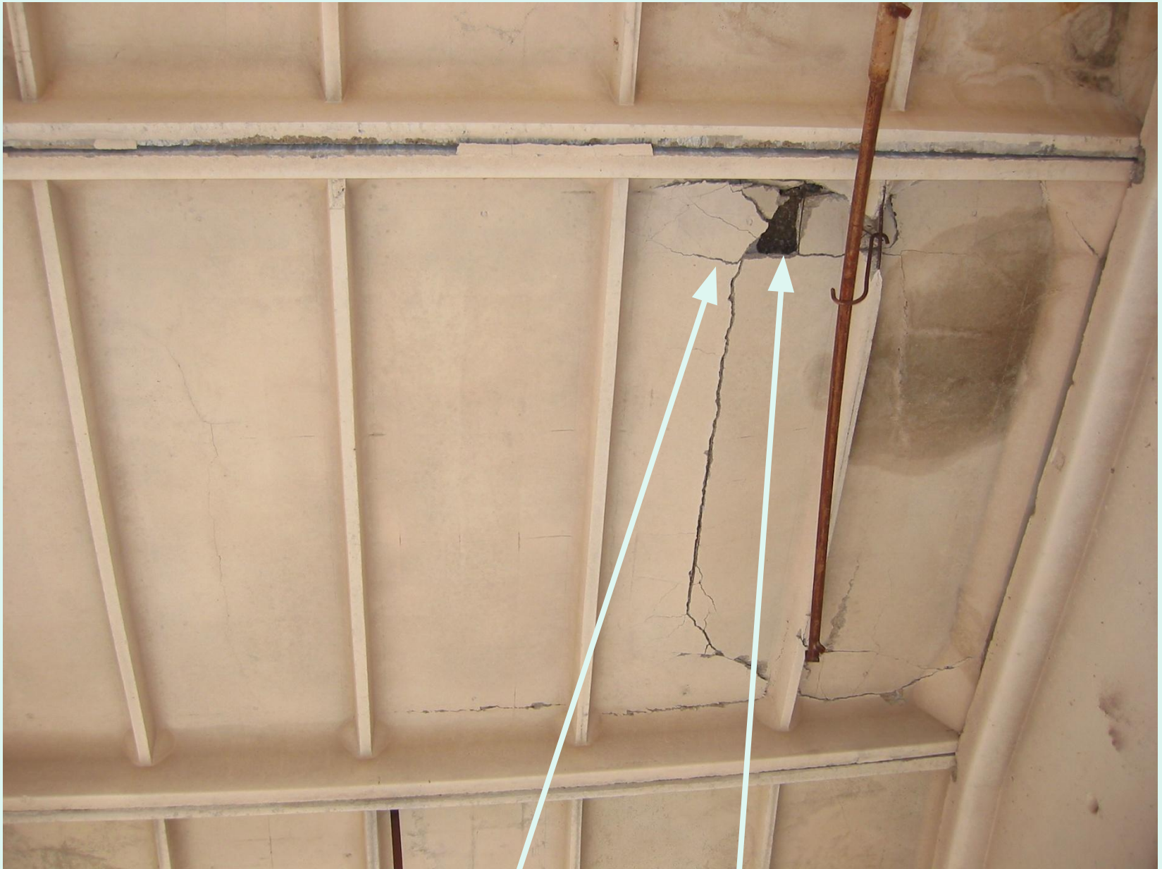
Трещины в полке плиты покрытия.