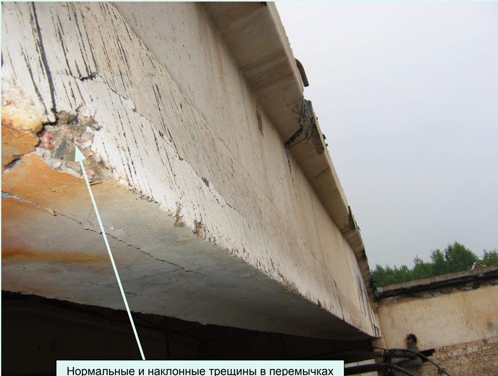
Нормальные и наклонные трещины в перемычках над проемами ленточного остекления. Продольные трещины под местами расположения арматуры