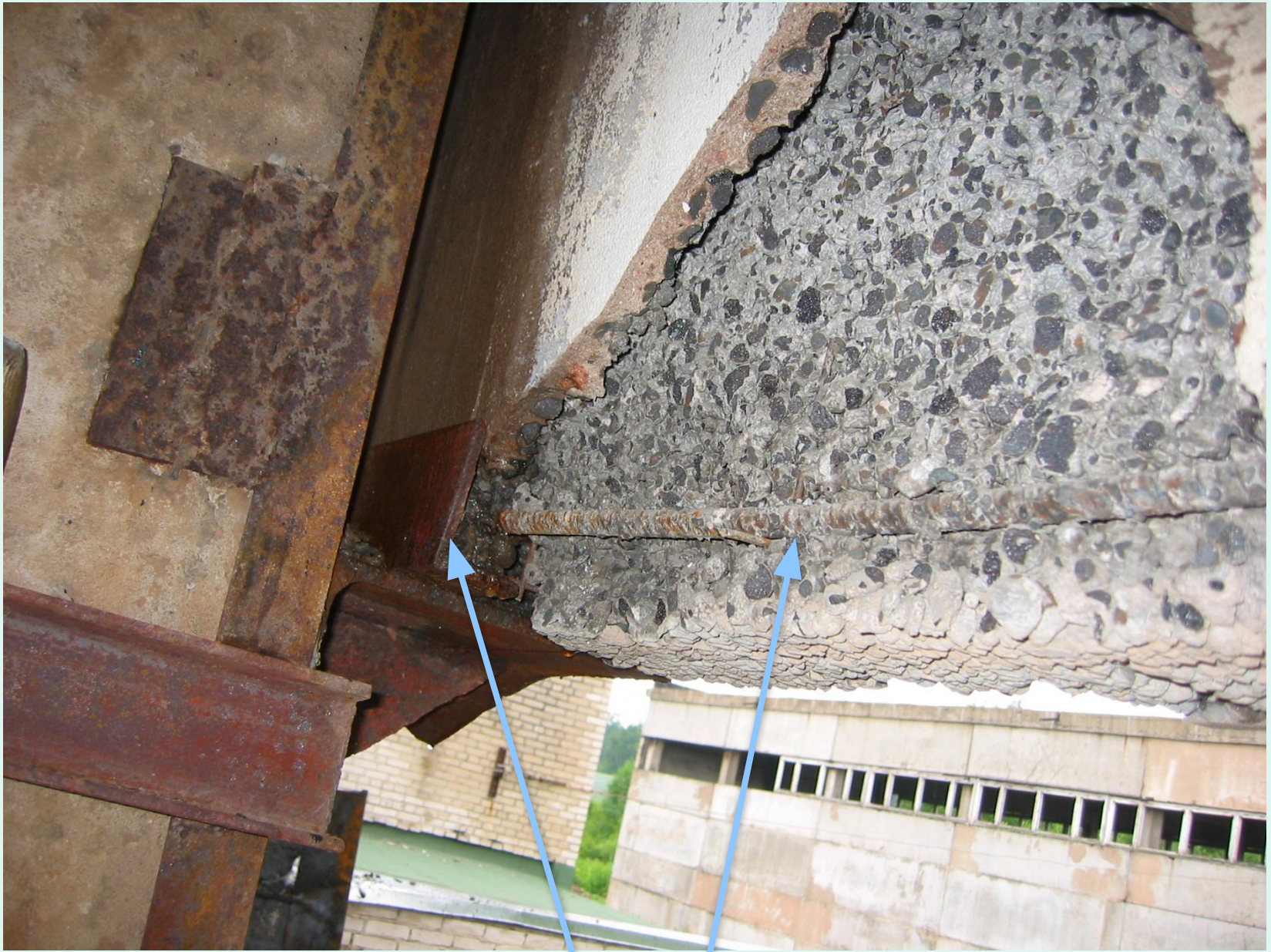
Отслоение защитного слоя бетона стеновой панели. Оголение и деформирование арматуры и закладных деталей.