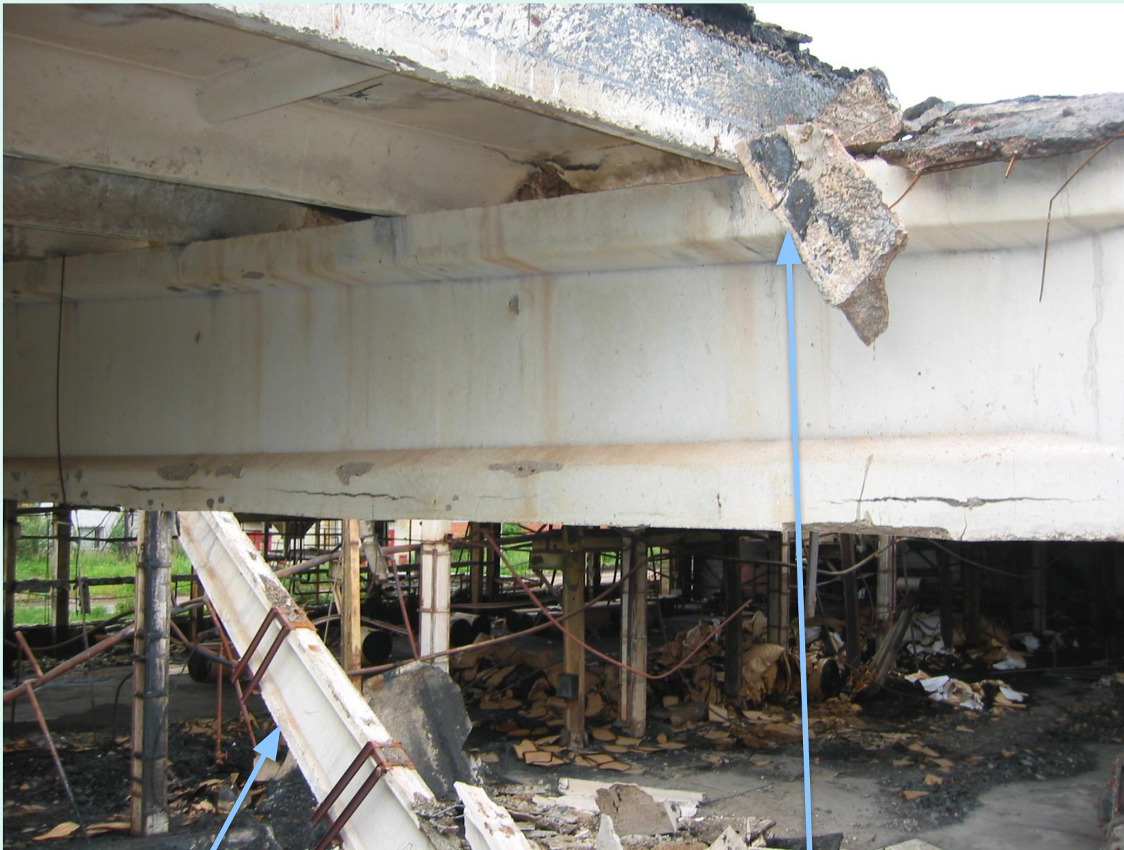
Обрушение стропильной балки