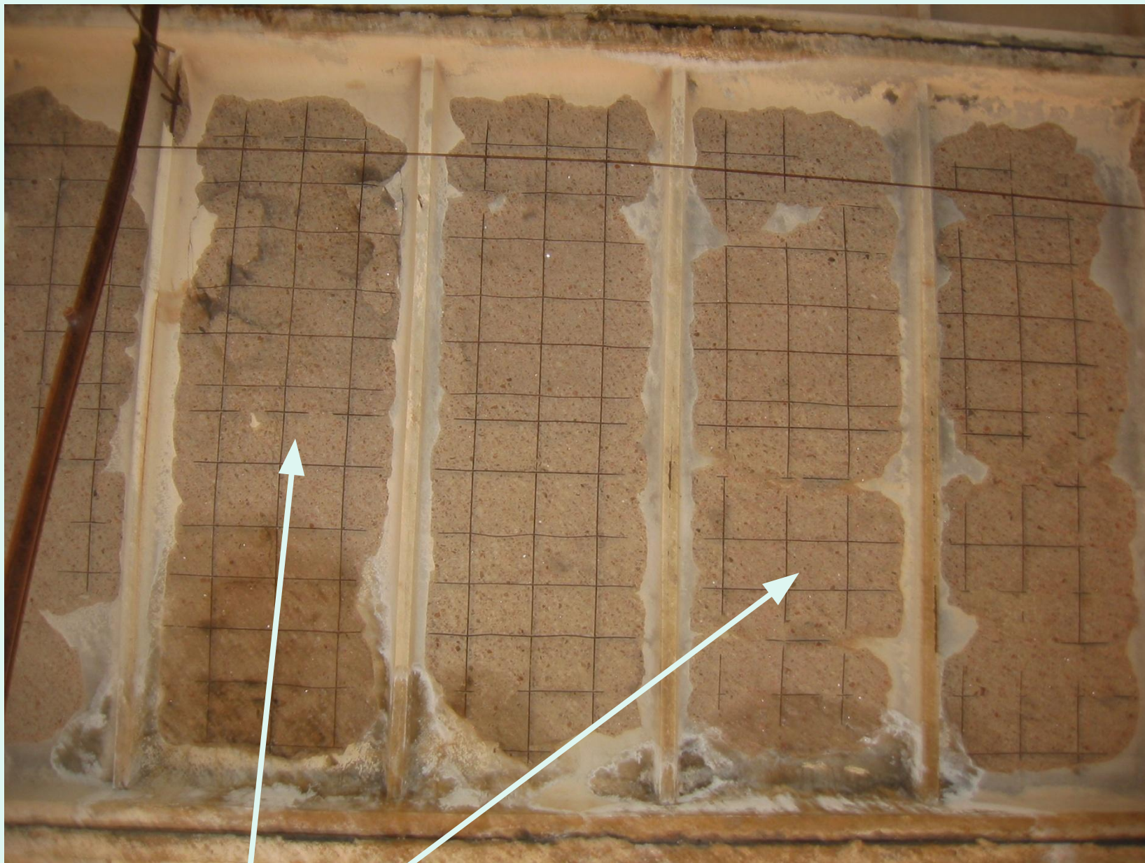
Отслоение защитного слоя бетона полок плит, оголение арматуры