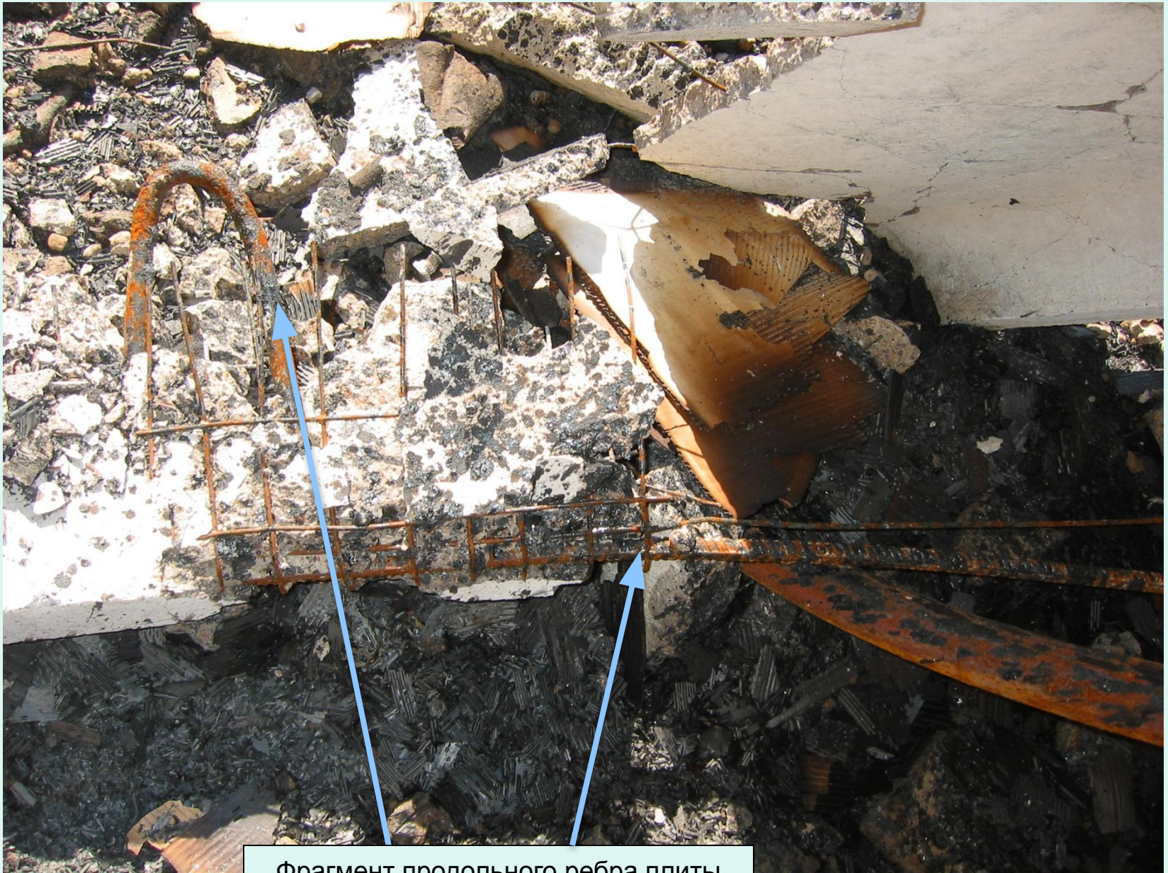
Фрагмент продольного ребра плиты покрытия (видны рабочая продольная арматура, сетки, монтажные петли)