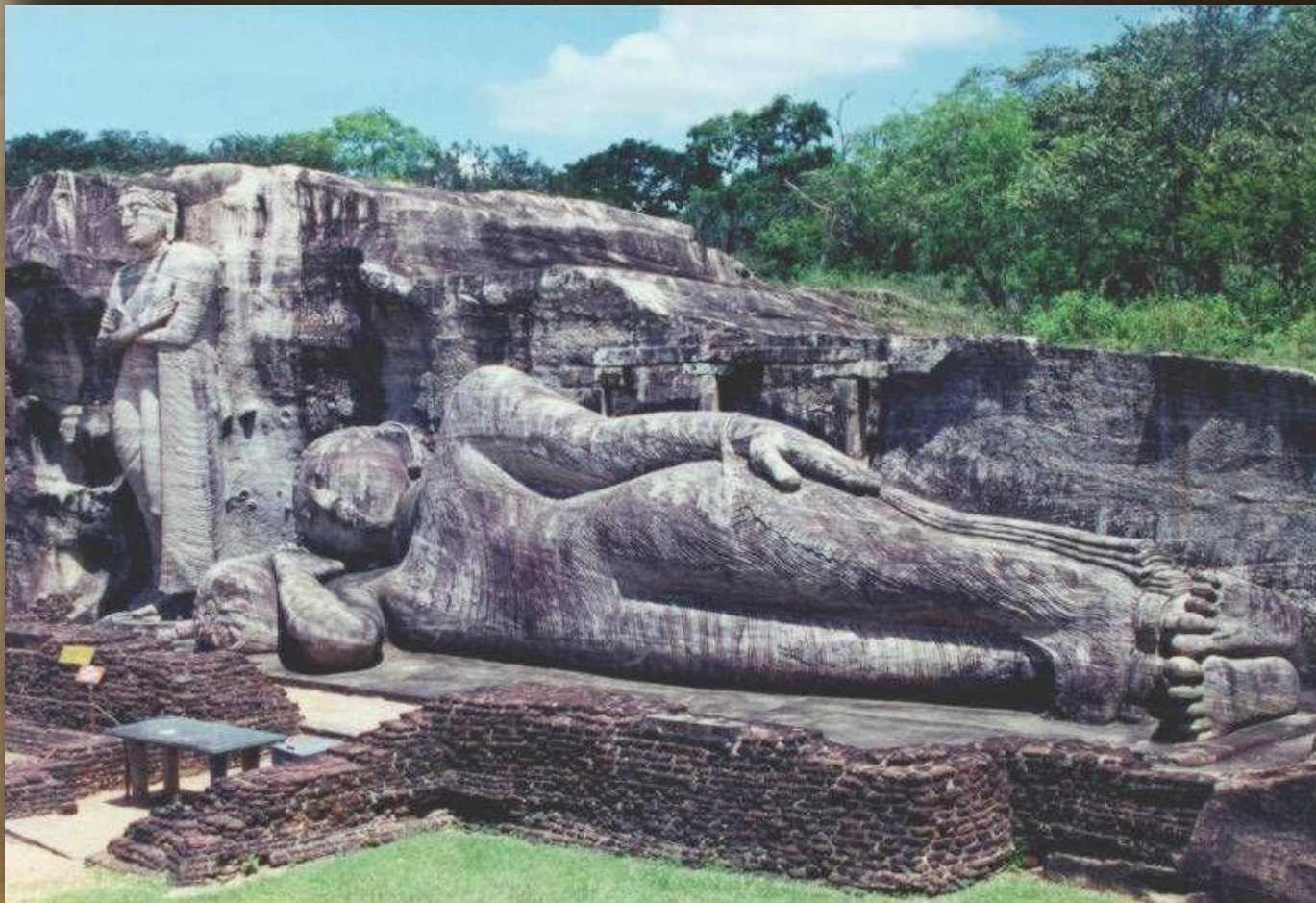
Будда в нирване, Шри Ланка, 12 век

Четыре Благородные Истины – это 4 принципа буддизма, провозглашенные Буддой и позволяющие достичь нирваны.