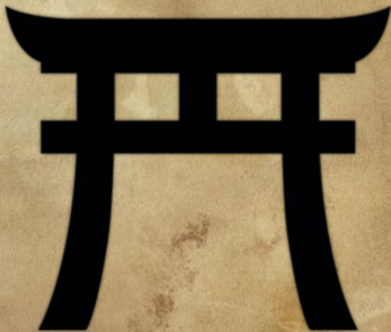
Символ синтоизма буддизма

В Японии две основные религии: синтоизм и буддизм.