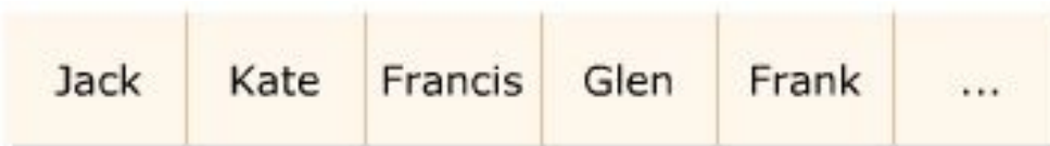
Array of 100 Names