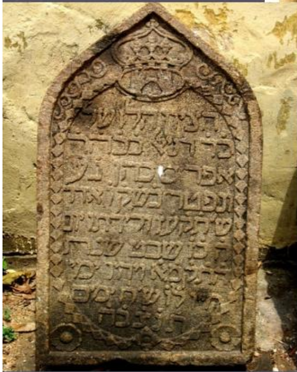
Плита с Десятью заповедями