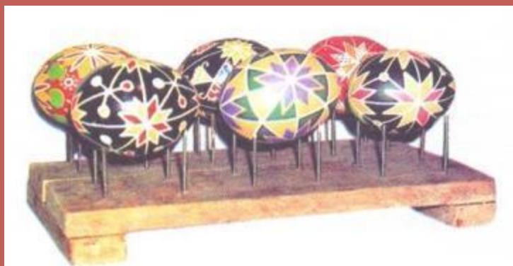
Подставка для сушки изделий