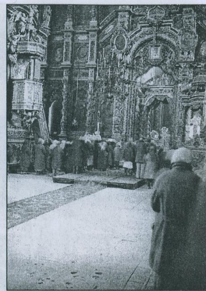
Одно из первых богослужений в Свято-Успенском кафедральном соборе г. Смоленска после его открытия в августе 1941 г.