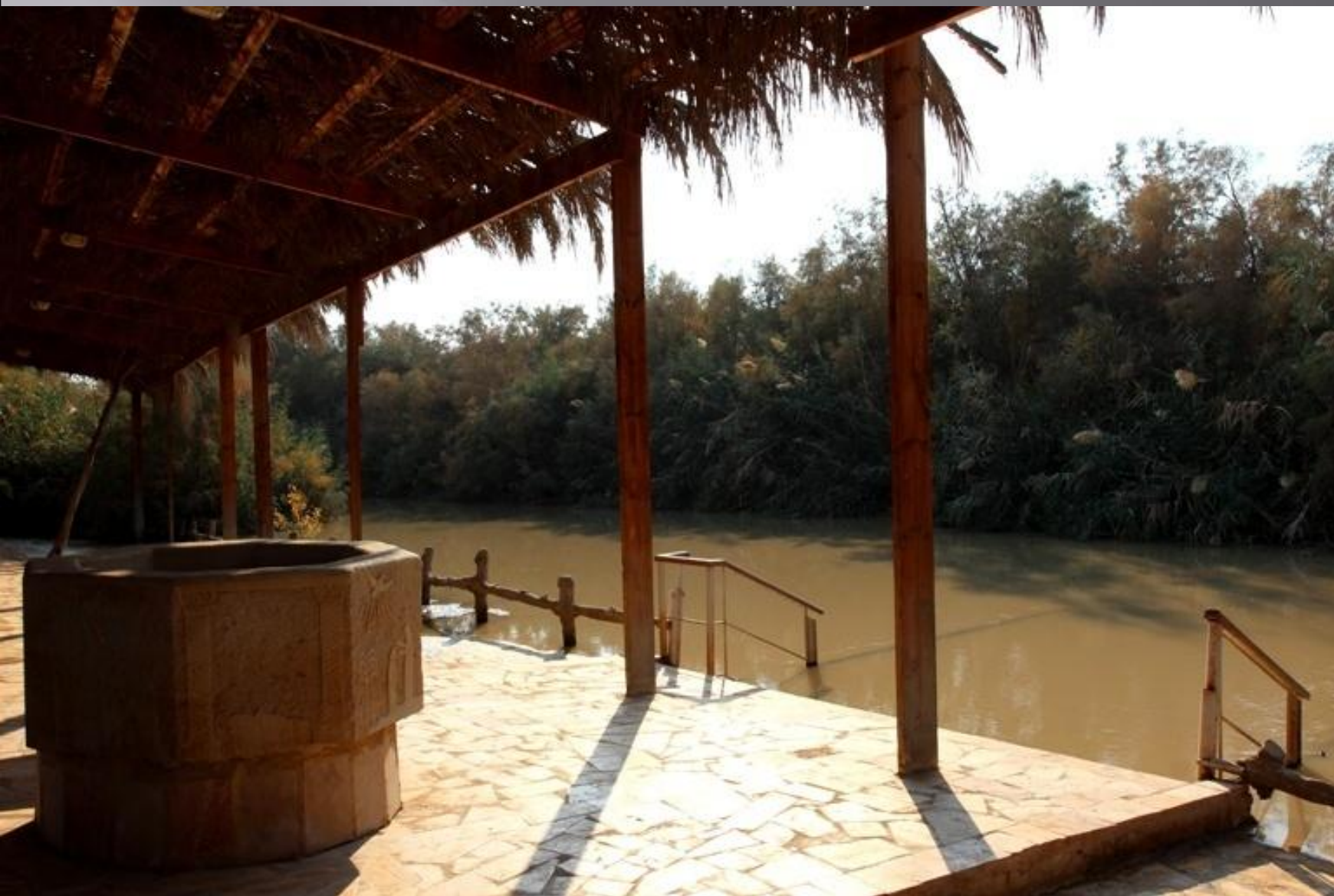
Река Иордан со стороны Иордании