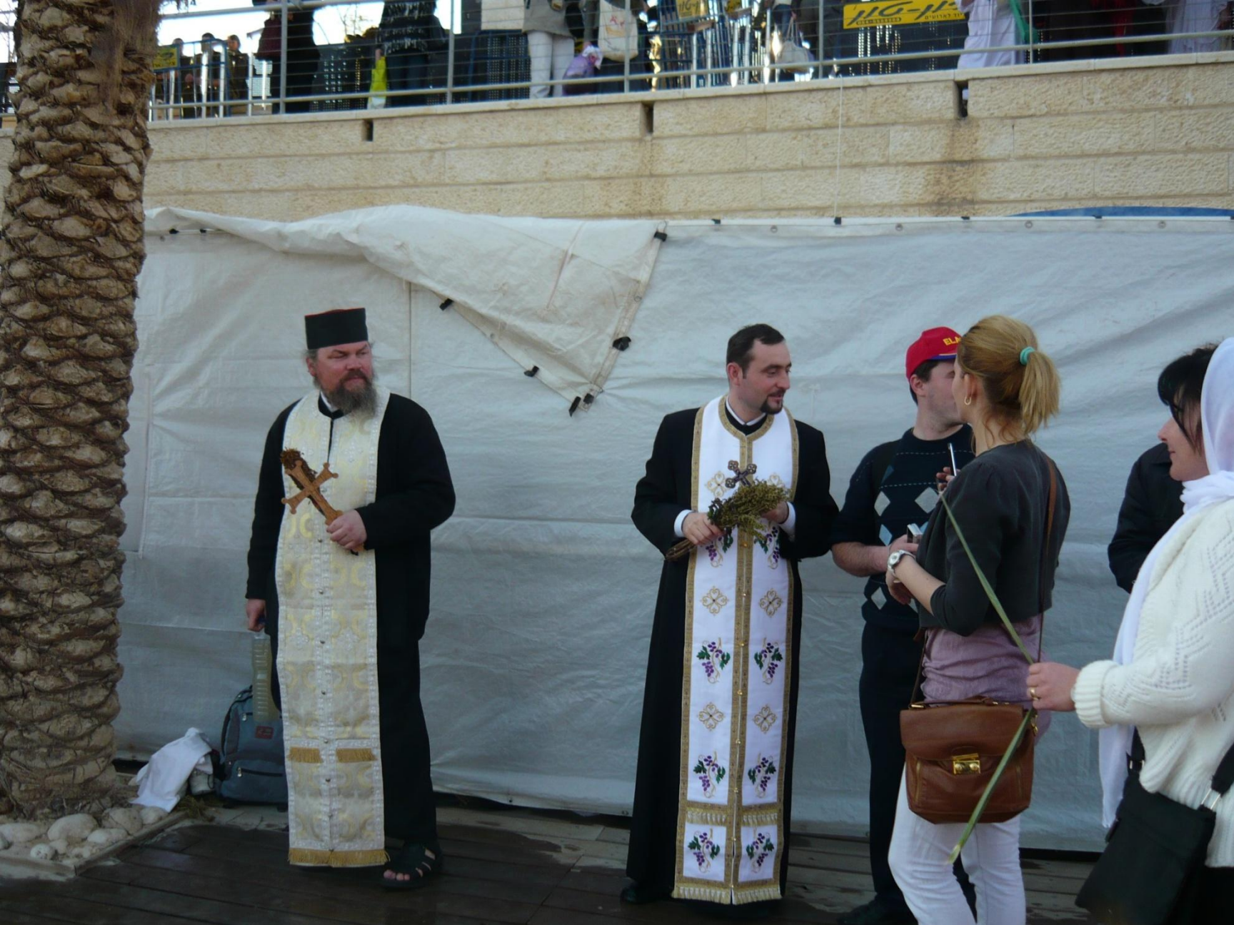
Греческие священники кропят святой водой букетиком из иссопа