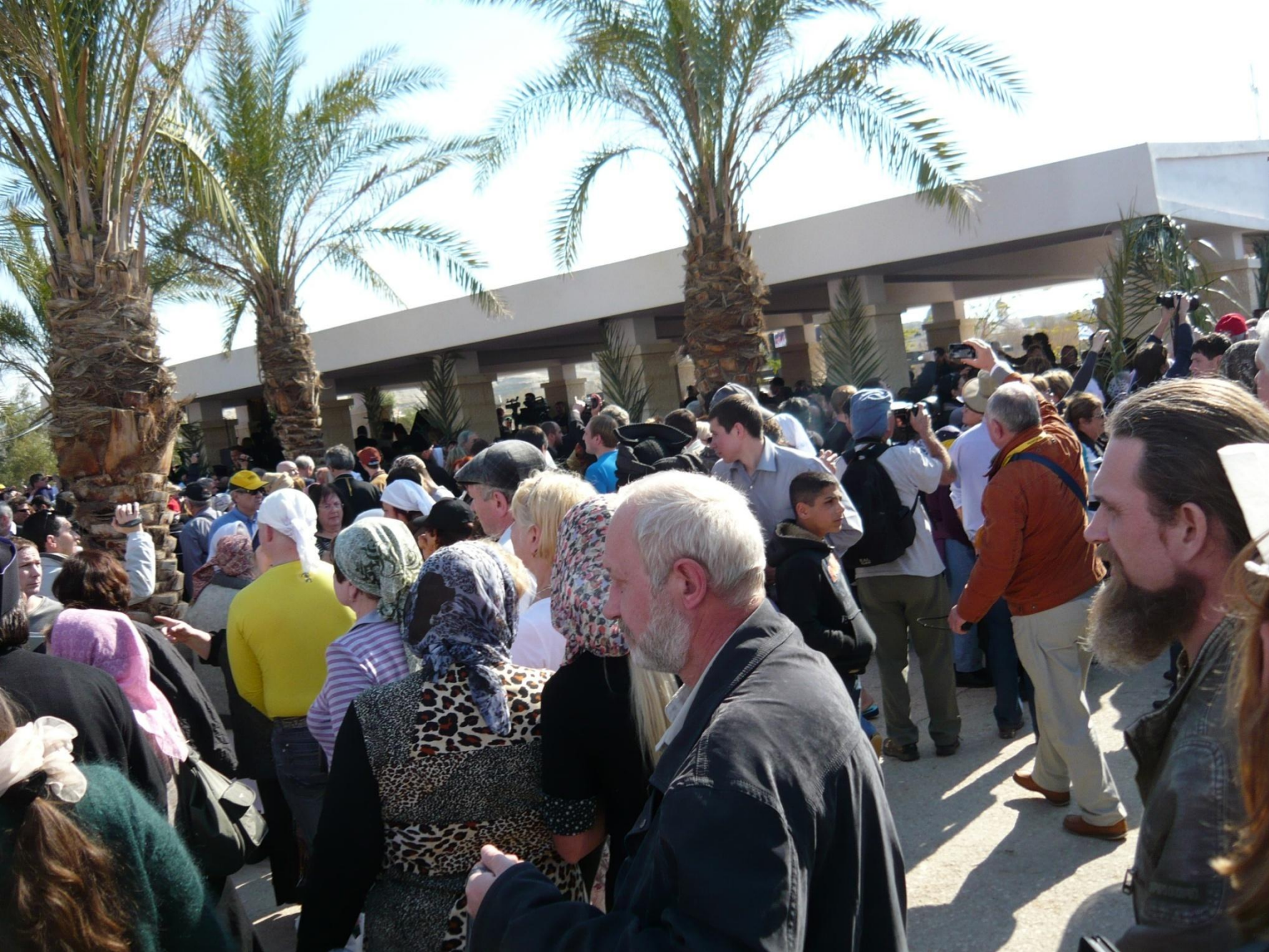
На заднем плане под крытым навесом – Ложа Иерусалимской Патриархии