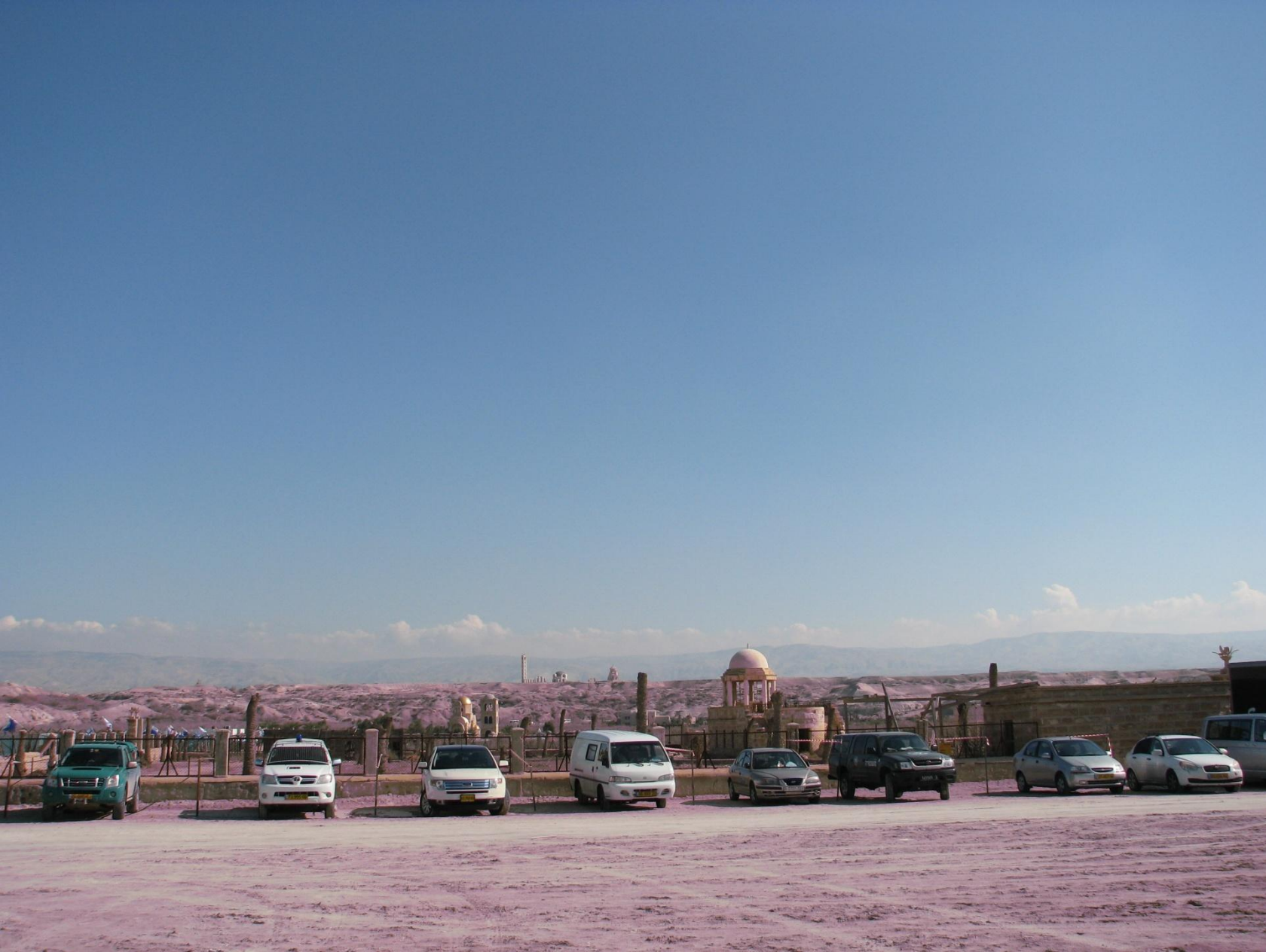
Стоянка автотранспорта, дальше до Иордана пешком