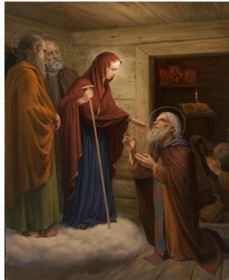
Явление пресвятой богородицы