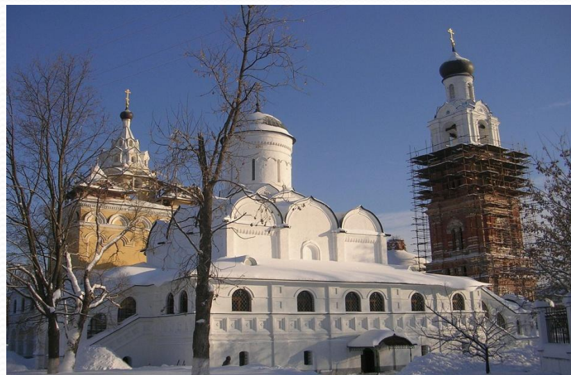
Благовещенский монастырь г.Киржач.