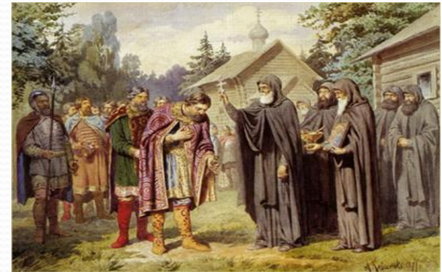
Предсказание великой победы Руси.