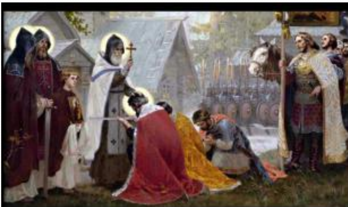
Благословение князя Дмитрия Сергием Радонежским.