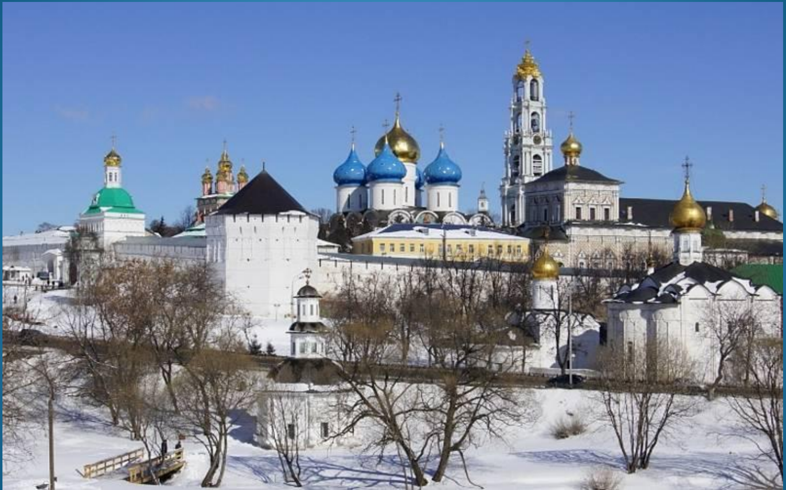
Ансамбль Троице-Сергиевой лавры.