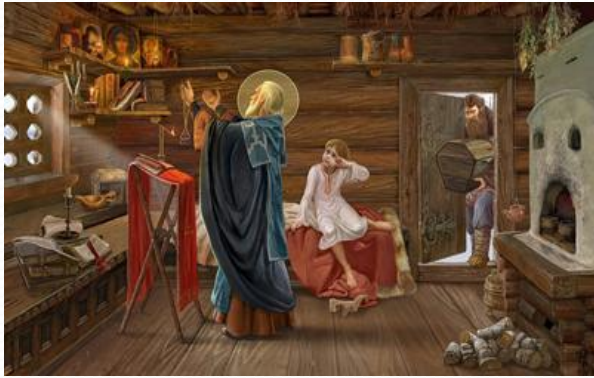
Исцеление больных людей