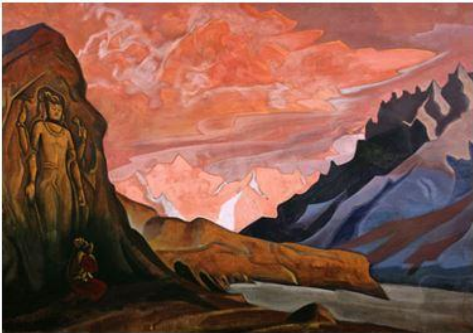
Н.К. Рерих. Майтрейя Победитель. 1925. Серия «Майтрейя».