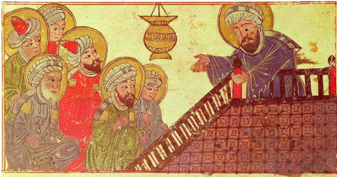
Проповедь пророка Мухаммеда, (Персия, 13 век.)

https://www.youtube.com/watch?v=Er15G19D5X4 см. до 5.15, выписать даты и события его жизни