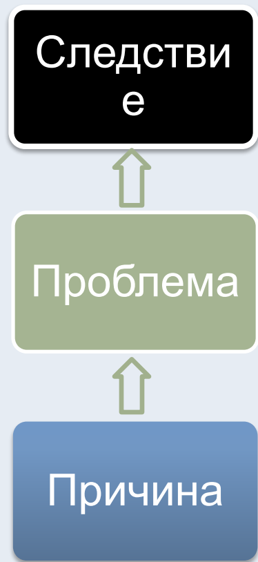
Схема работы с проблемным полем