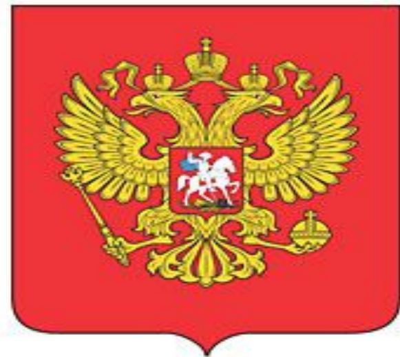
Герб утверждён в декабре 2000 г.

Широкий простор для мечты и для жизни Грядущие нам открывают года. Нам силу дает наша верность Отчизне. Так было, так есть и так будет всегда! Гимн России - оркестр.mp3