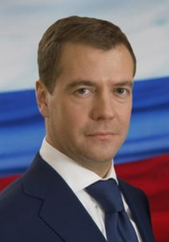
Медведев Дмитрий Анатольевич- президент Российской Федерации