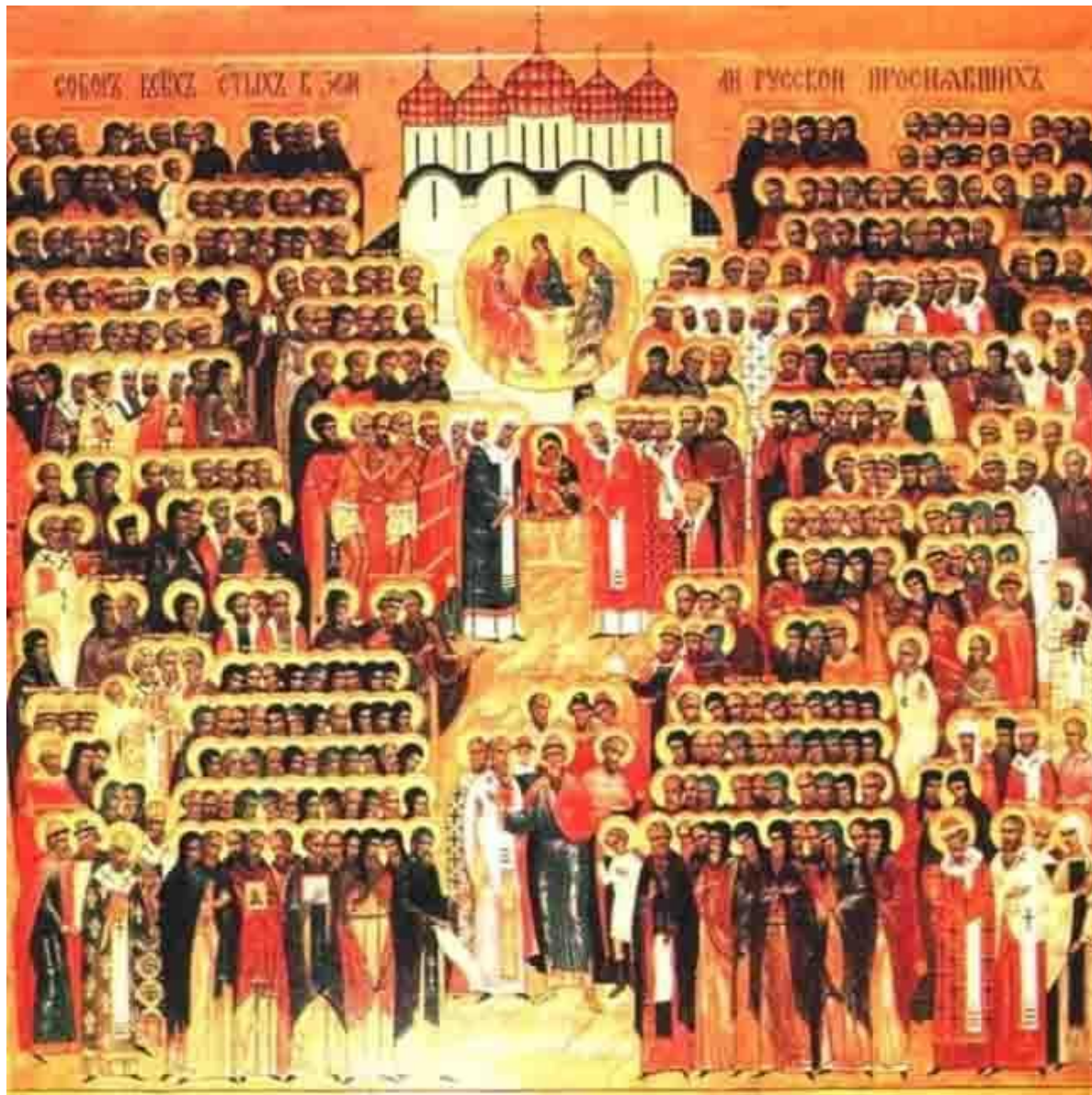
Икона Всех Святых, в земле Российской просиявших