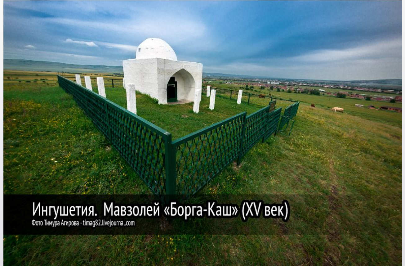
Ингушетия. Мавзолей «Борга-Каш» (XV век)