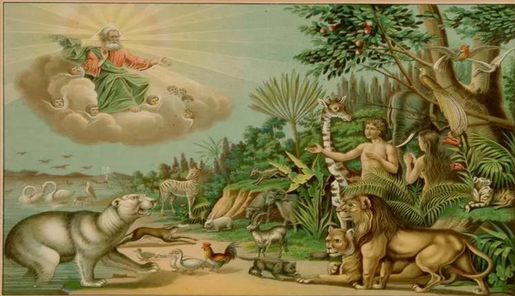
ПЕРВЫЕ ЧЕЛОВЕКИ ВЪ РАЮ АДАМЪ И ЕВА.

Среди животных не было вражды: сильные не трогали слабых, все жили вместе и питались травой и растениями. Никто из них не боялся людей, и все любили и слушались их. Но высшее счастье Адама и Евы состояло в общении с Богом. Господь являлся им в раю видимым образом, как отец детям, и беседовал с ними.