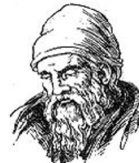
Евклид (365-300 до. н. э.)