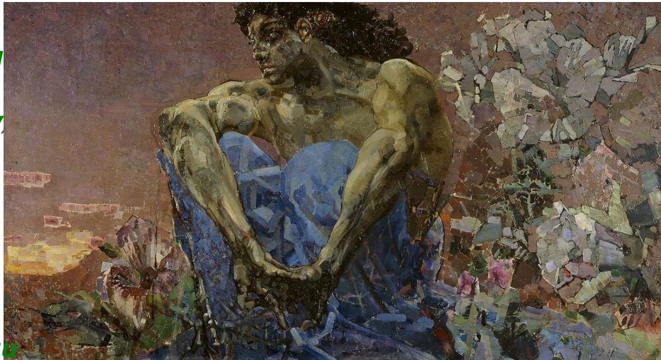
«Демон сидящий» Михаил Врубель 1890 г.

Один из ангелов, Денница «Утренняя заря» возгордился, и решил, что может стать равным Богу, к нему примкнули другие ангелы и восстали против Бога, но были низвержены в ад. Денница получил прозвище Диавол, или Сатана (клеветник, противник), а падшие вместе с ним ангелы – демоны (бесы).