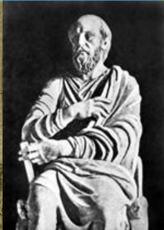
сщмч. Ипполит Римский