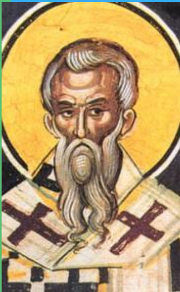
сщмч. Киприан Карфагенский