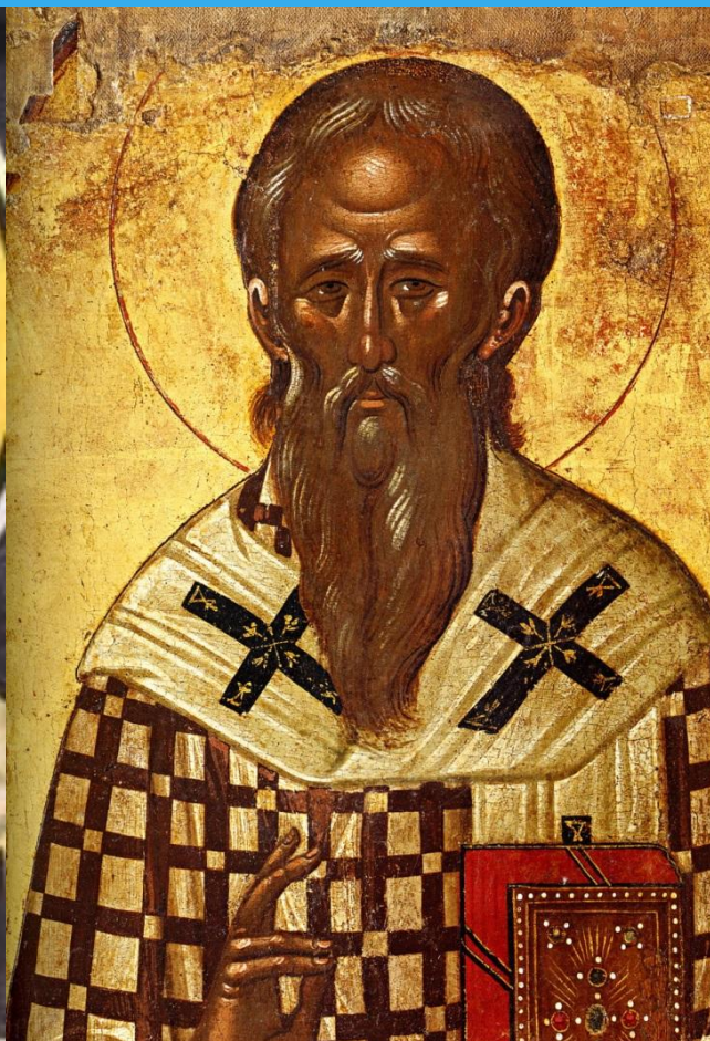
свт. Кирилл Иерусалимский