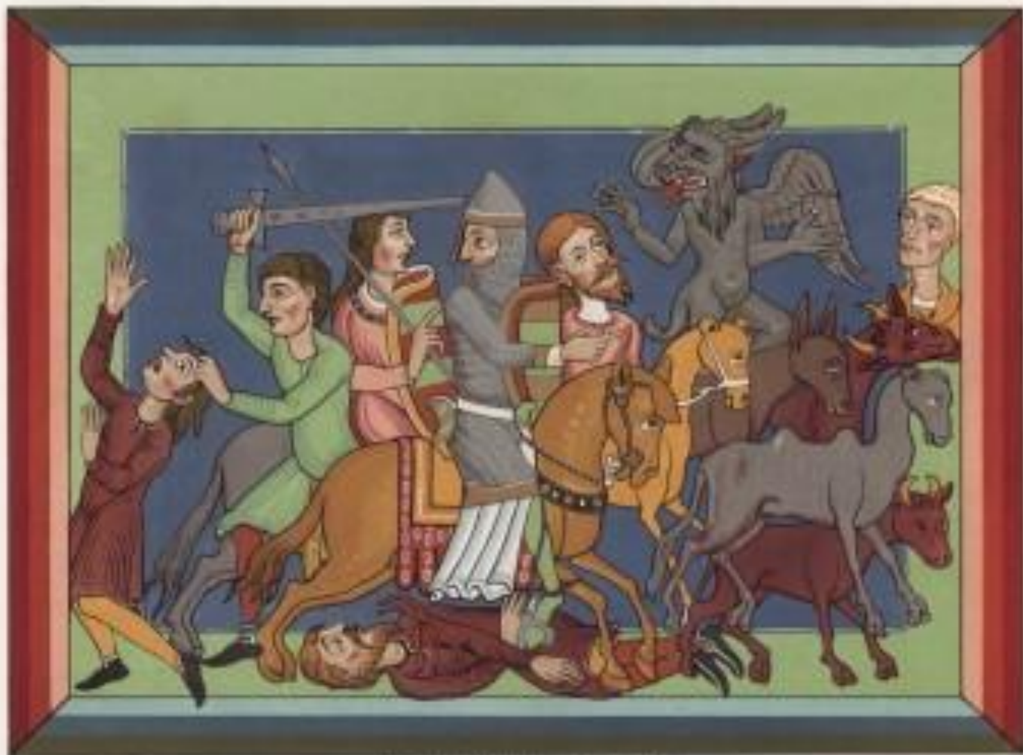
Château de Saint-Basle - Musée de Saint-Basle