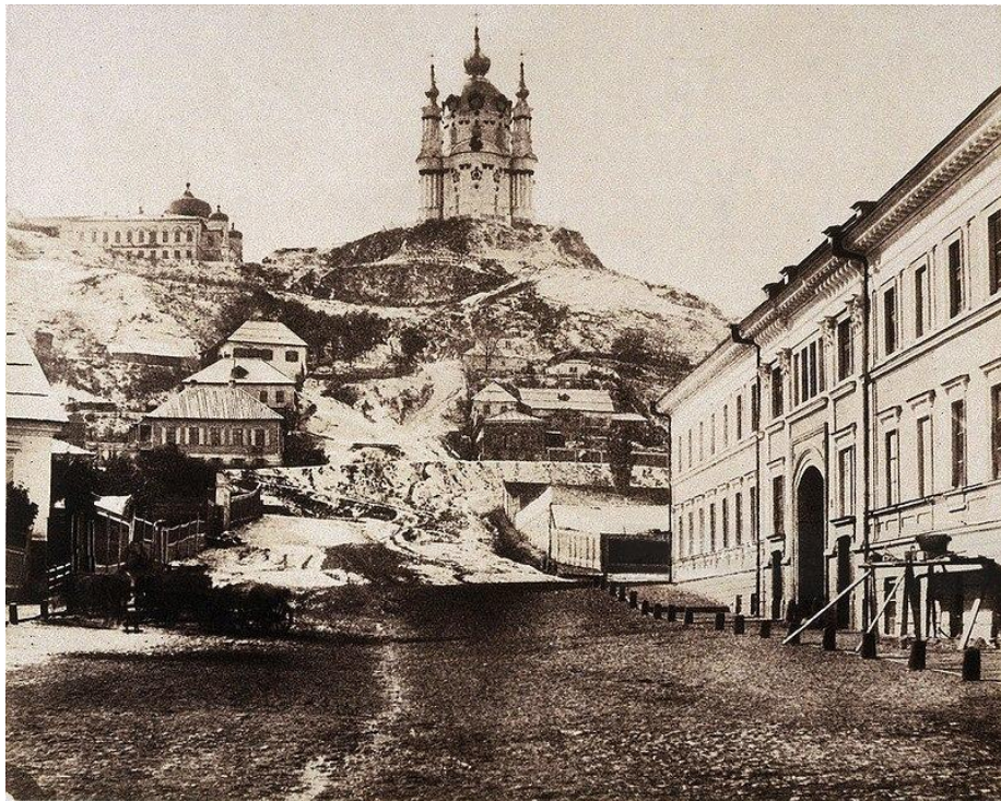
Саме старе фото Андріївської церкви