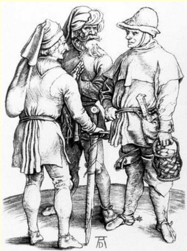
Крестьяне в XVI в. в Германии.