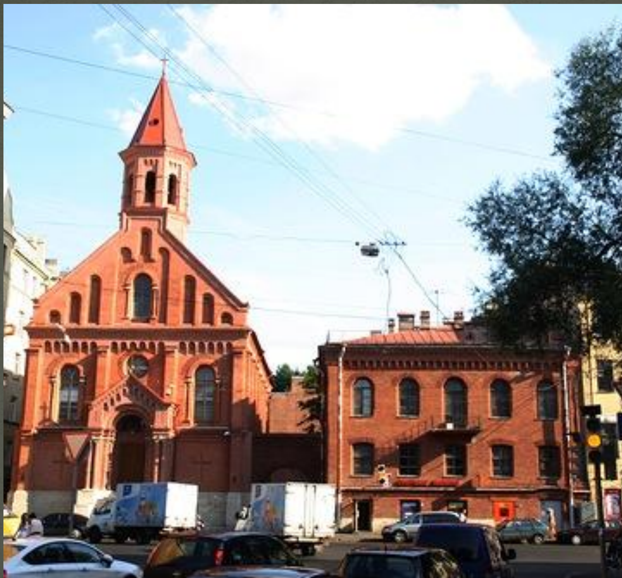
Эстонская церковь святого апостола