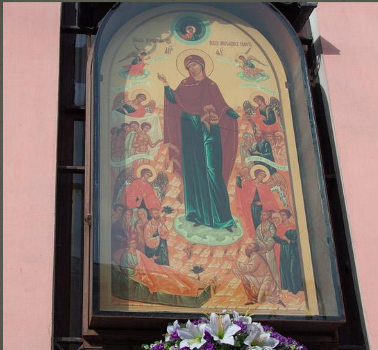
Икона Божией Матери «Всех скорбящих Радость»