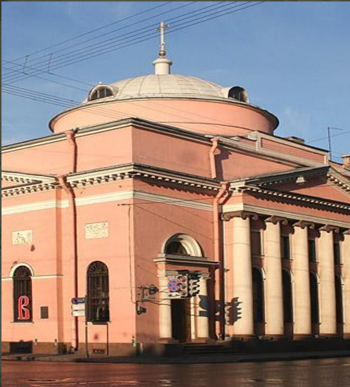
Храм иконы Божией Матери «Всех скорбящих Радость» на Шпалерной улице