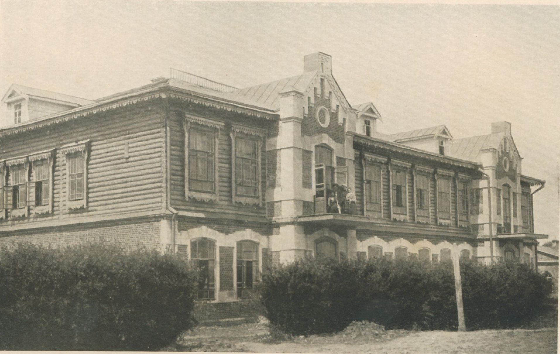
2-х классная школа для девочек (10-17 лет) в учебном комплексе А.И. Новикова, фото ок. 1902