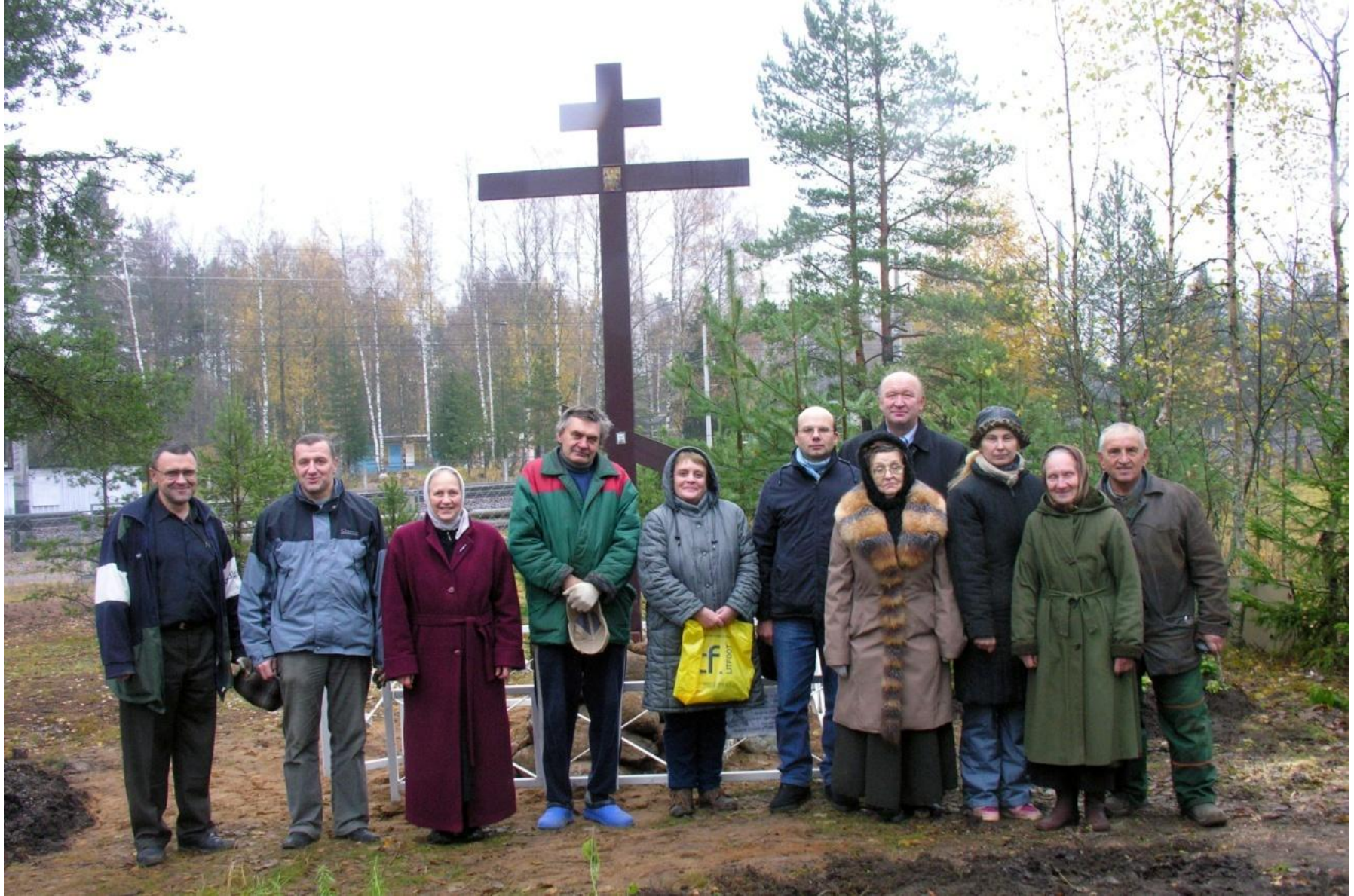
Начало возрождения храма в п. Мустамяки-(п.Яковлево)