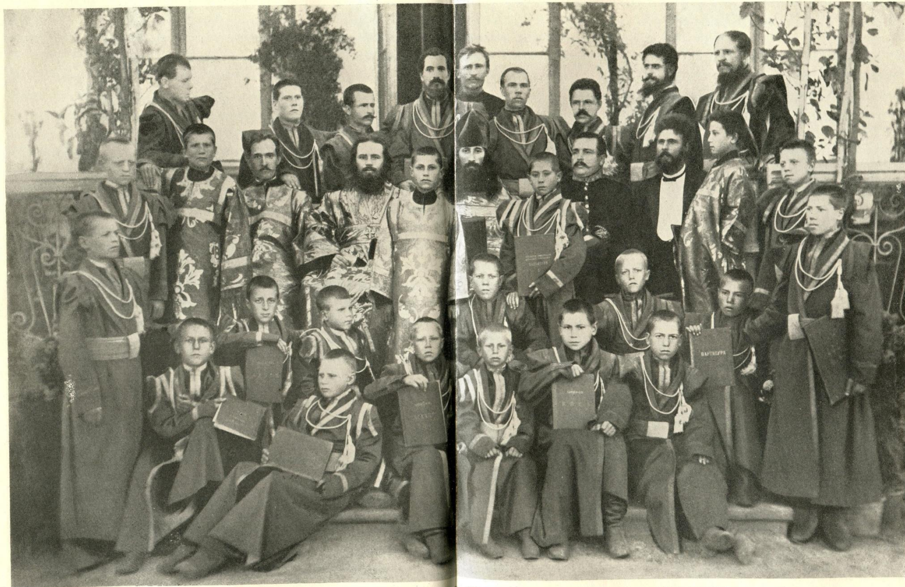
THE CLERGY AND CHOIR OF NOVO-ALEXANDROFKA, 1900 ON THE DAY OF THE CONSECRATION OF THE CHURCH

Рис. 12. Клер и школа в День освящения домового храма в церковно-учительской школе, 1900 г.