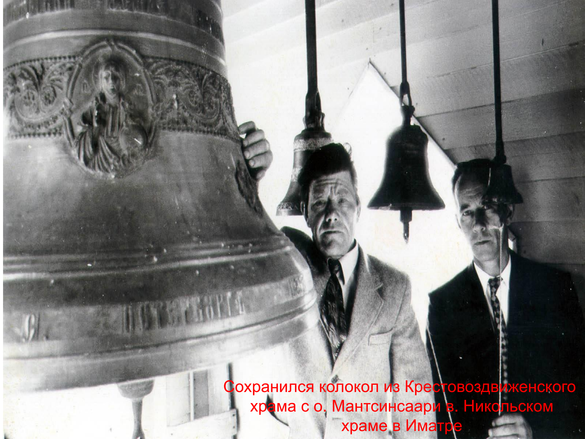
Сохранился колокол из Крестовоздвиженского храма с о. Мантсинсаари в. Никольском храме в Иматре