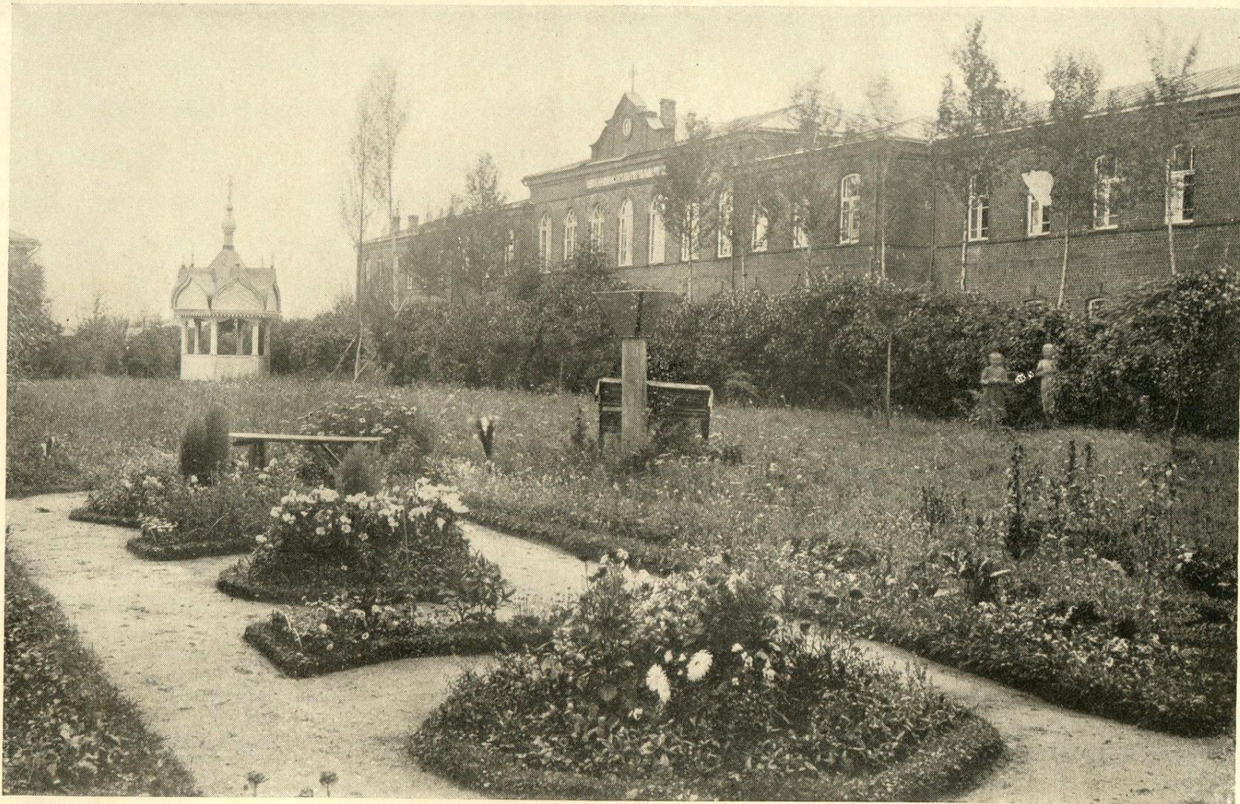
SEMINARY FOR 125 SCHOOL TEACHERS BUILT BY ALEXANDER NOVIKOFF AT NOVO-ALEXANDROFKA