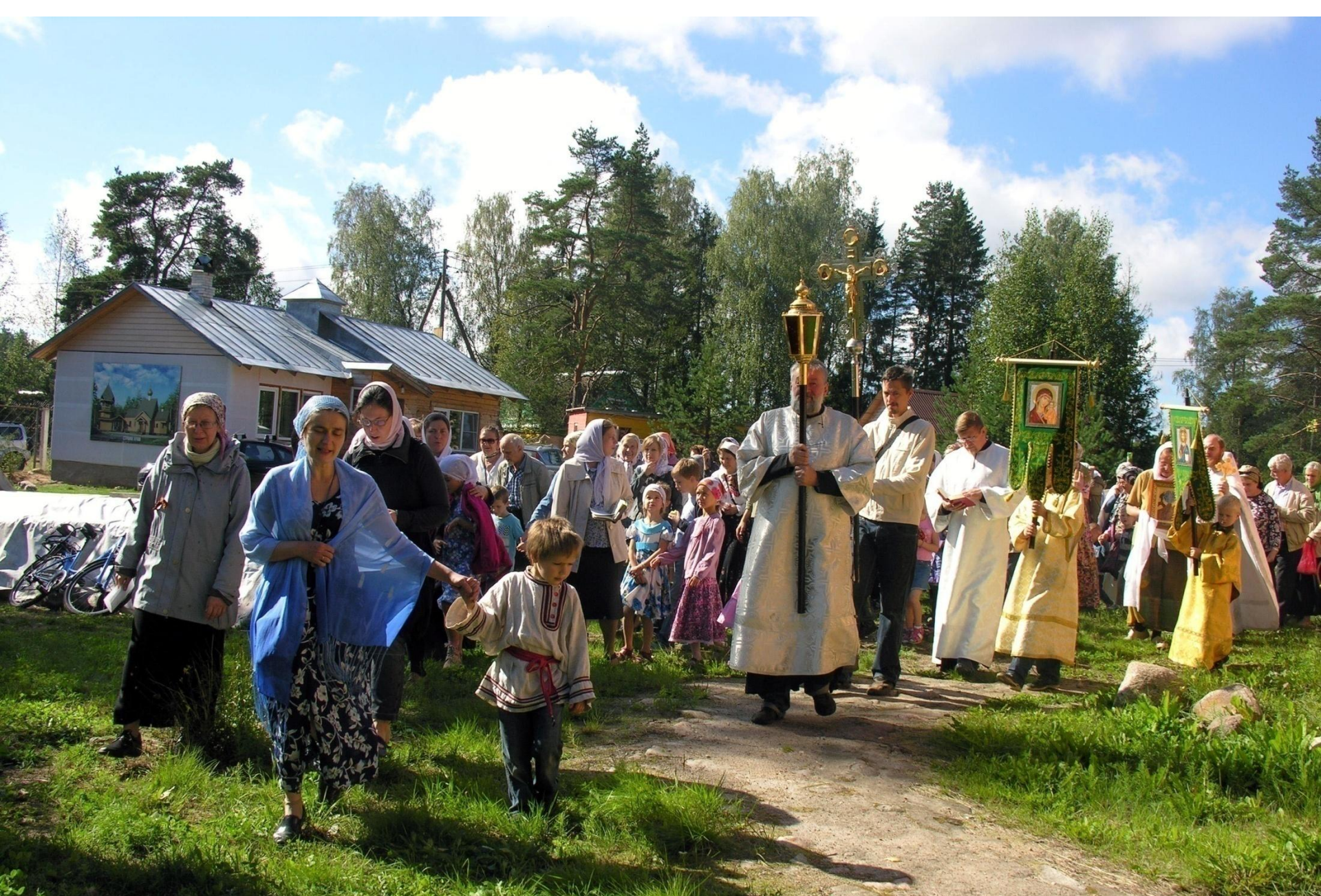
Престольный праздник - Преображение Господне, п. Яковлево