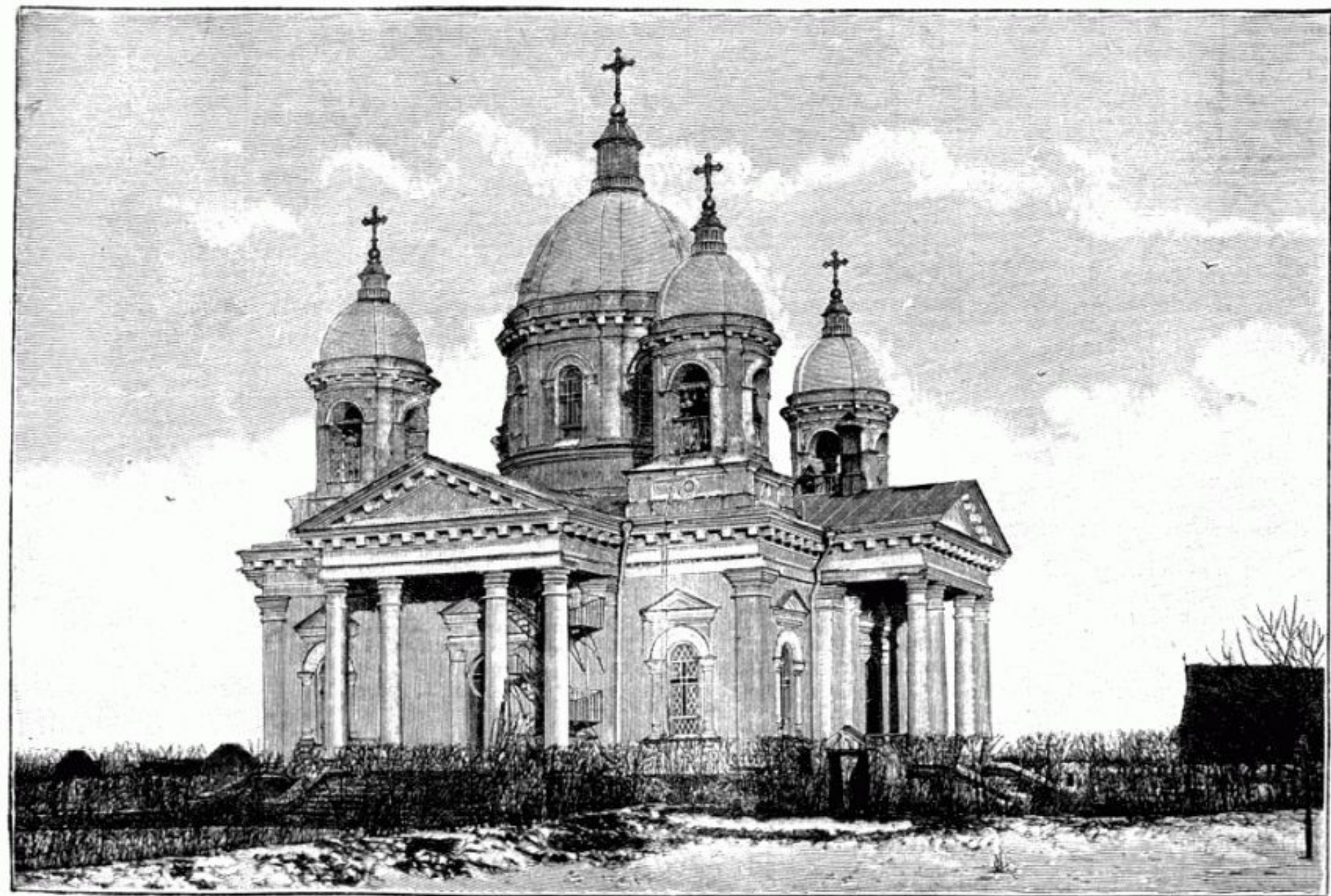
Иоанно-Богословская церковь въ с. Ново-Александровкѣ, козловскаго уѣзда тамб. губ. По фот. грав. Рашевскій.

Храм Иоанна Богослова в селе Ново-Александровка (Новиково)