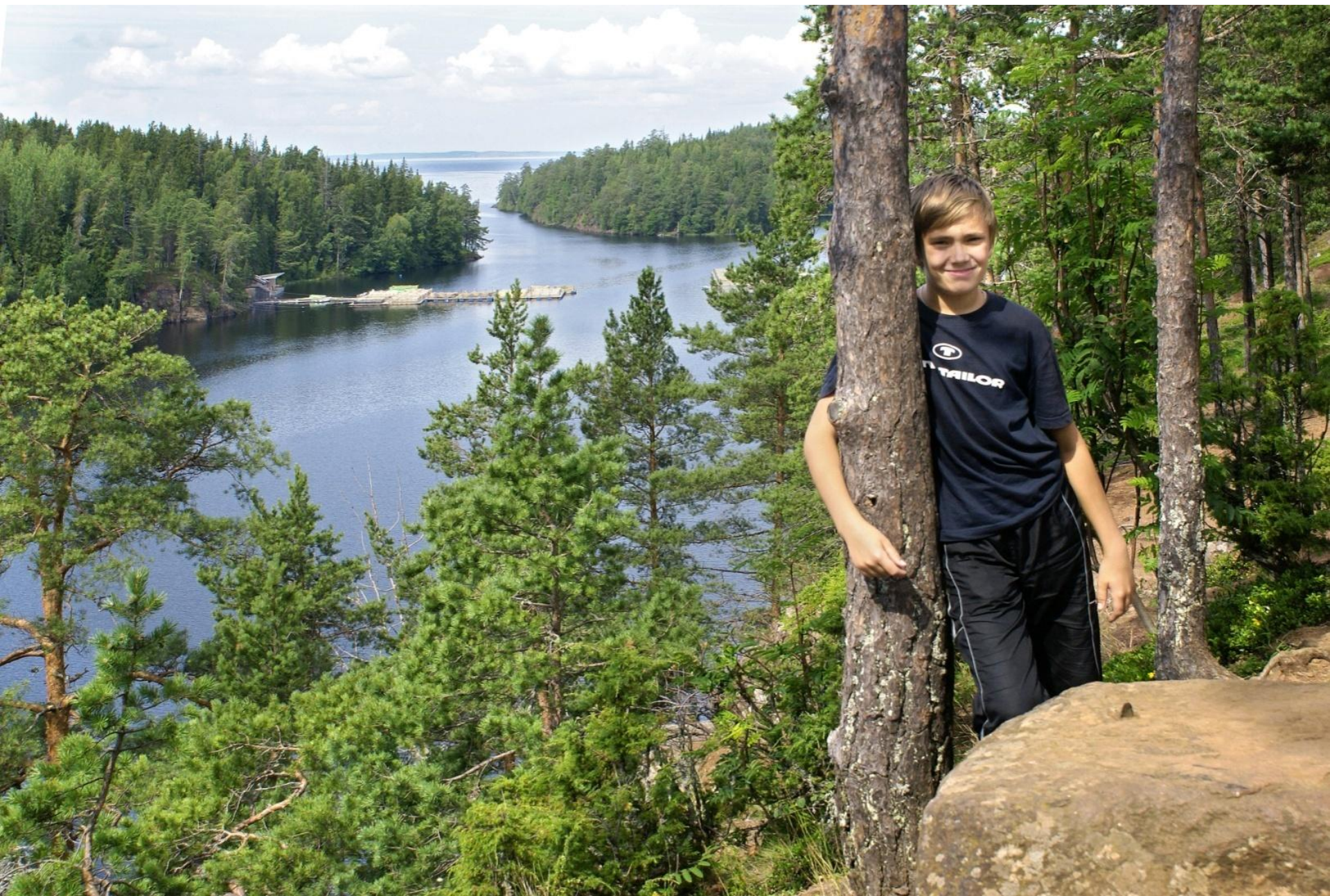
Архипелаг Валаам на Ладожском озере в наши дни.