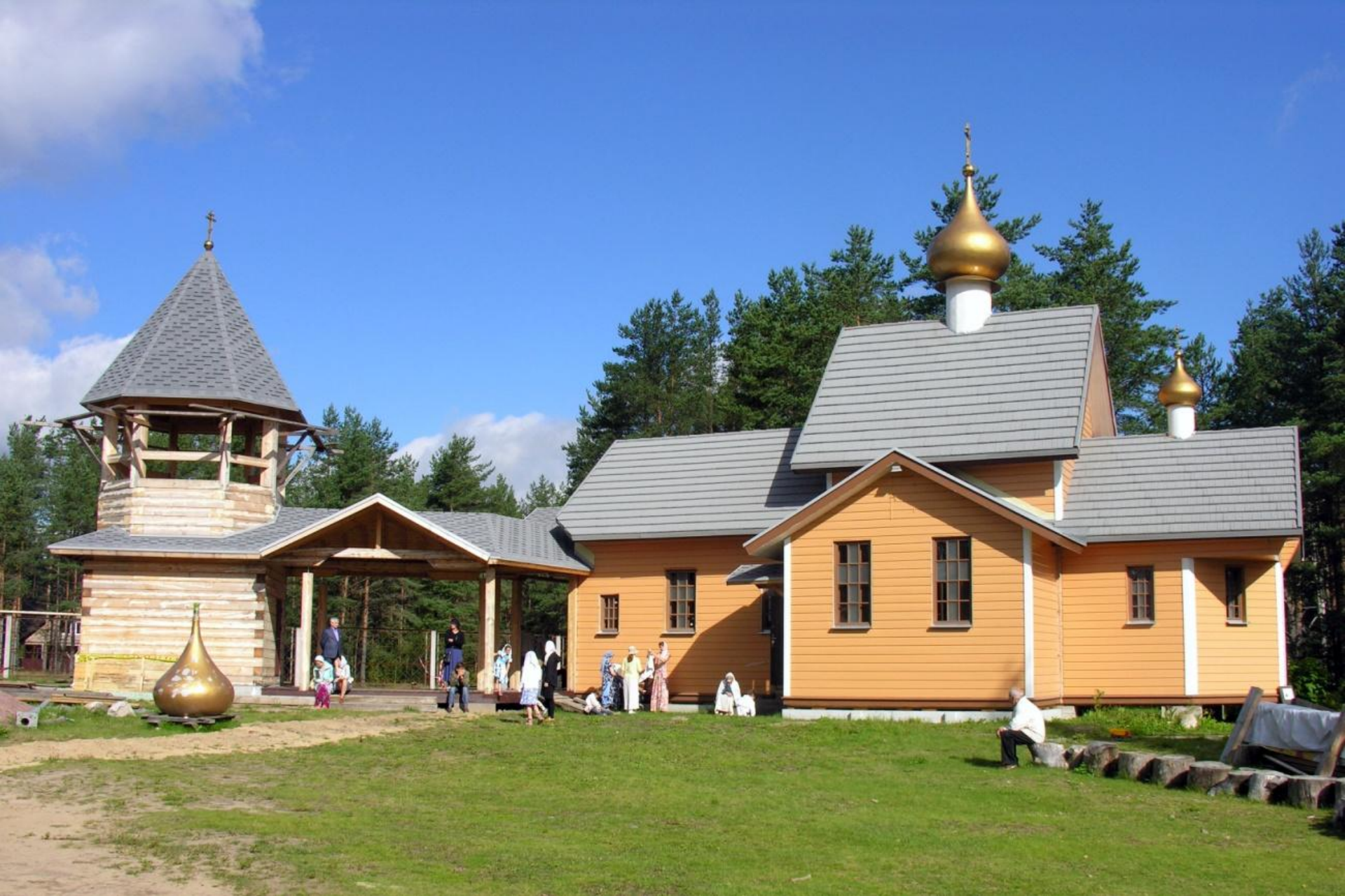
Храм Преображения Господня в Яковлево