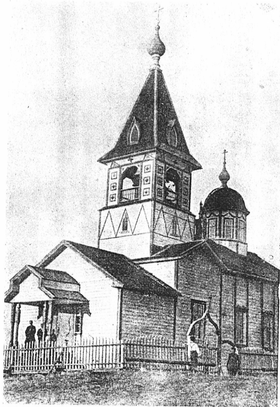
Ristin ylentämisen kirkko Manttsinsaari