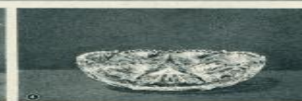
Наборы из стекла (1) и хрусталя (2, 3, 4).