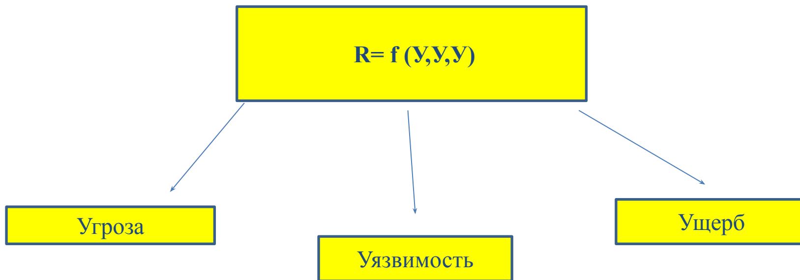
Рис оценивается исходя из серьезности выявленных угроз и уязвимостей.

Очередной этап взаимных оценок отличает необходимость демонстрации эффективности выстроенной «противоотмывочной» системы. Во главу угла ставятся риски клиентов учреждений, обслуживающих частный сектор. А также операционные и региональные риски.