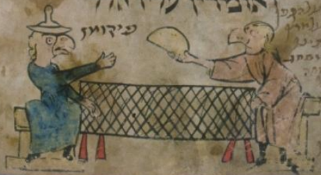
Птицеголовая агада, f.29v