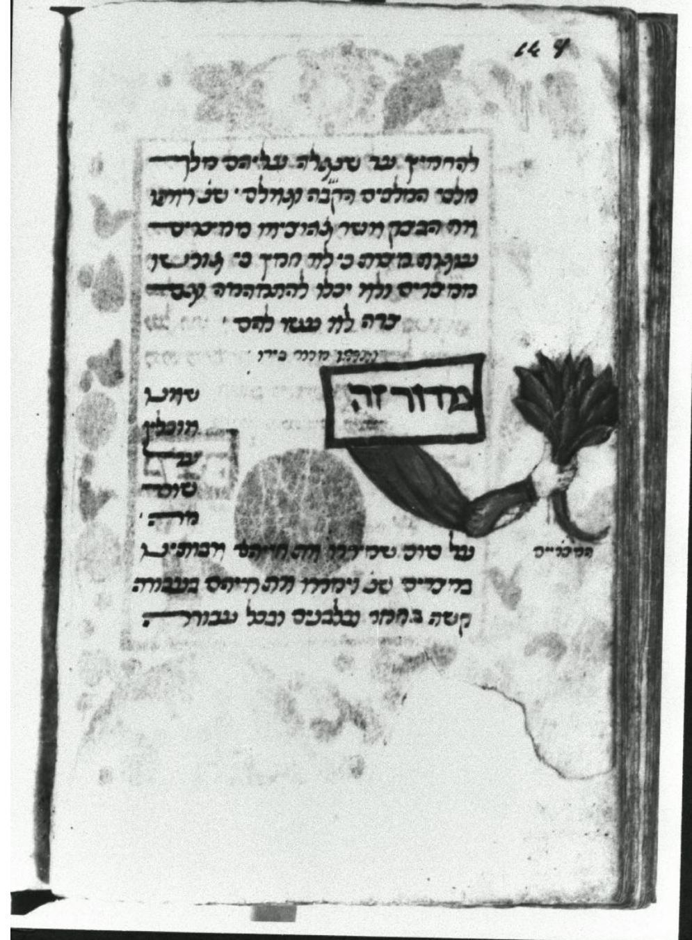
Ватиканский Итальянский сиддур, кон. XV в., f.148v