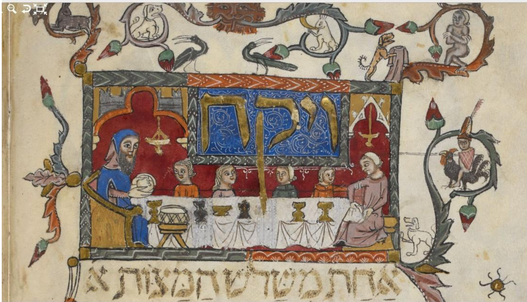
Барселонская агада, f.20v