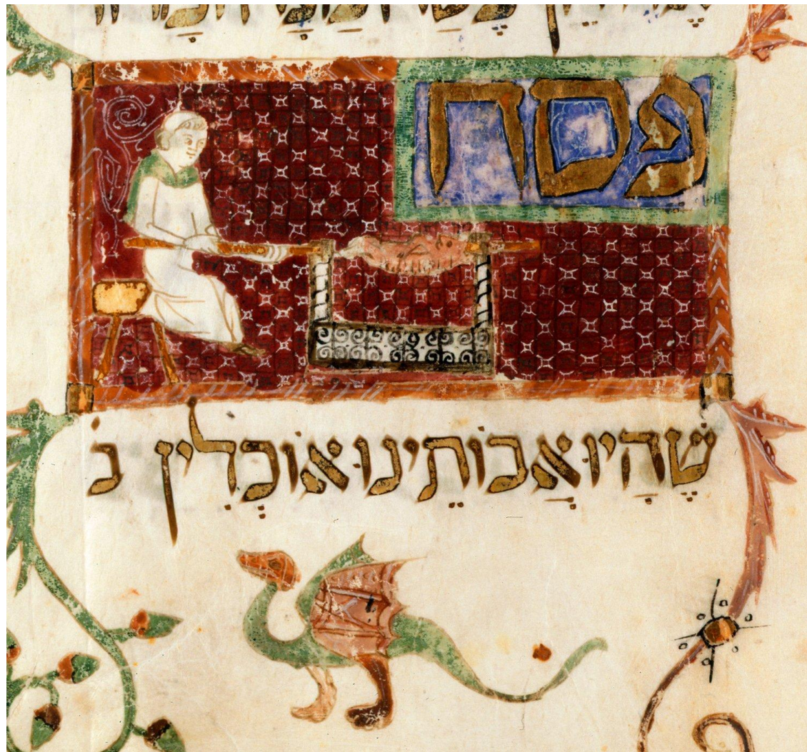
Барселонская агада, f.60r