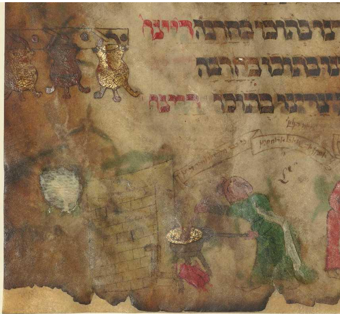
Агада Хилека и Билека, f.17r