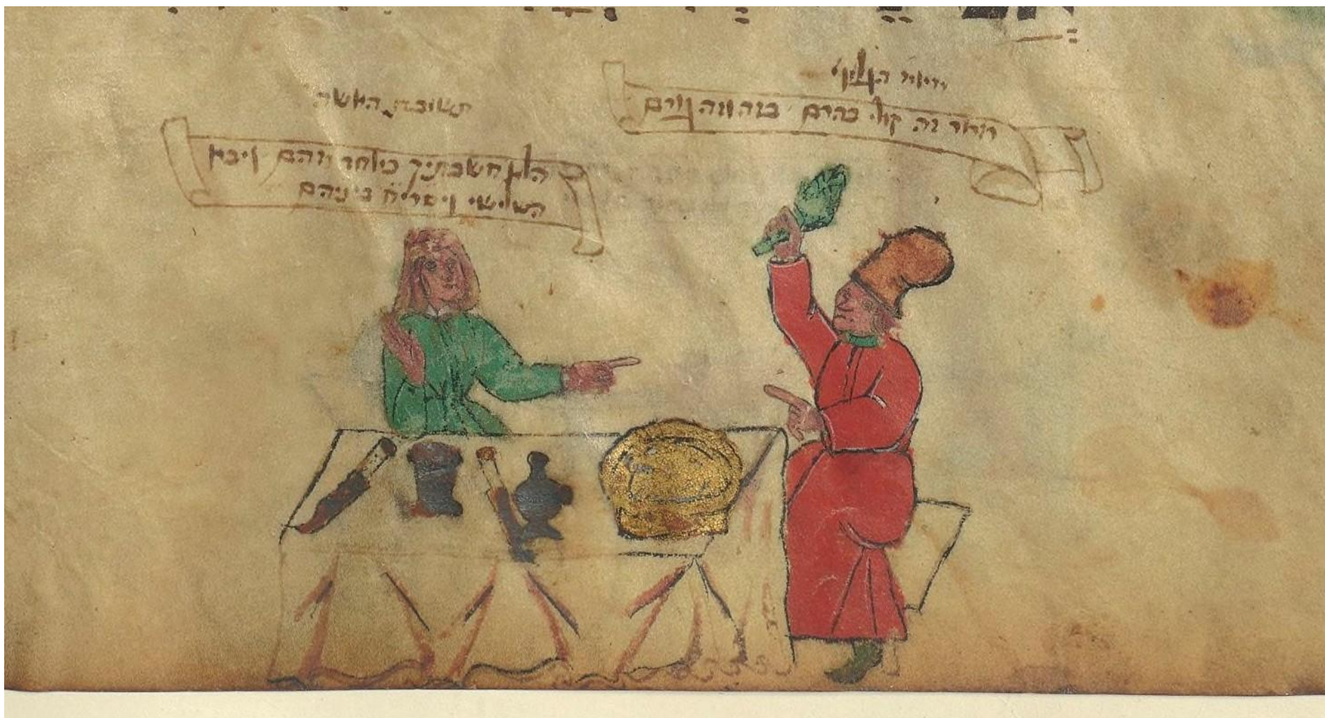
Агада Хилека и Билека, 2-я пол. XV в., f.19v