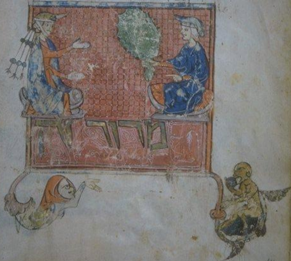
Агада Сассуна, 1-я пол. XIV в., f.57v

עונות מצות מלא חמץ נורשן מצרים ולא יכו להתמהמה ונס ערה חמץ