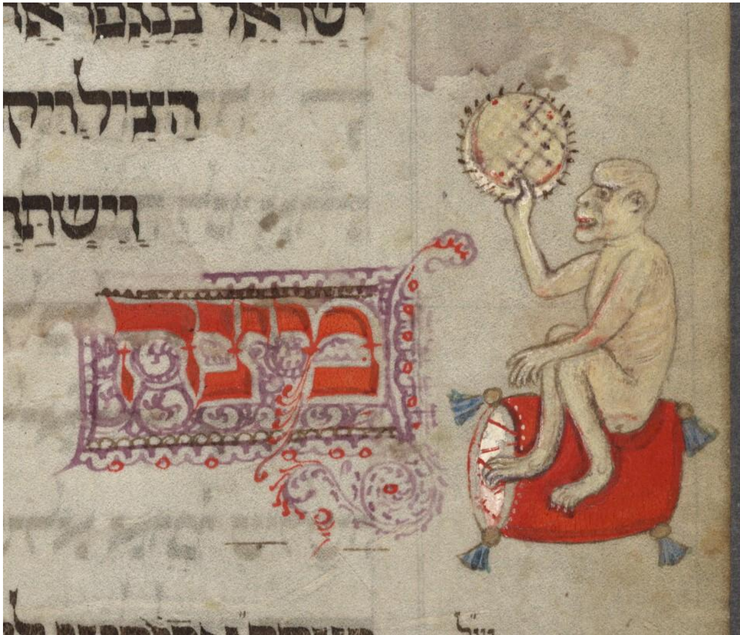
Вашингтонская агада, f.15v