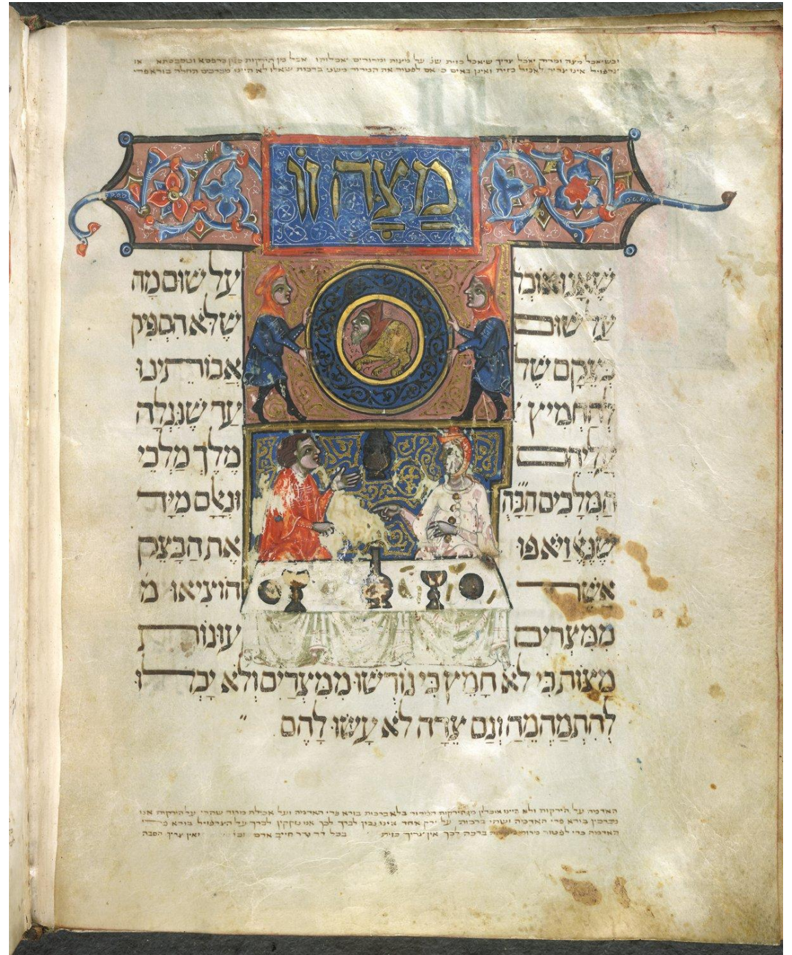
Агада-Брат, f. 17v