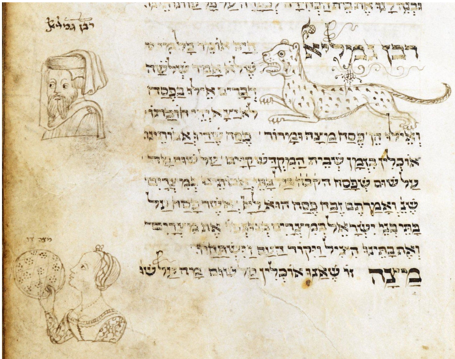
Итальянский сиддур из Британской библиотеки, f.45r