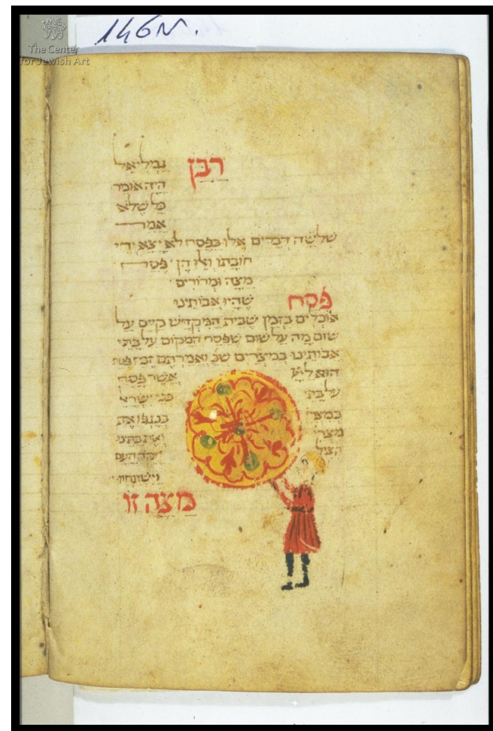
Агада Мёрфи (слева, f.20v ) и Моденский махзор (1439, f.146v)