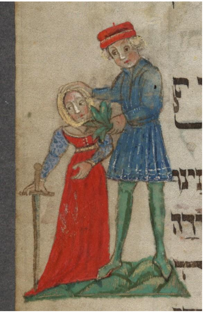
Вашингтонская агада, 1478, f.16r