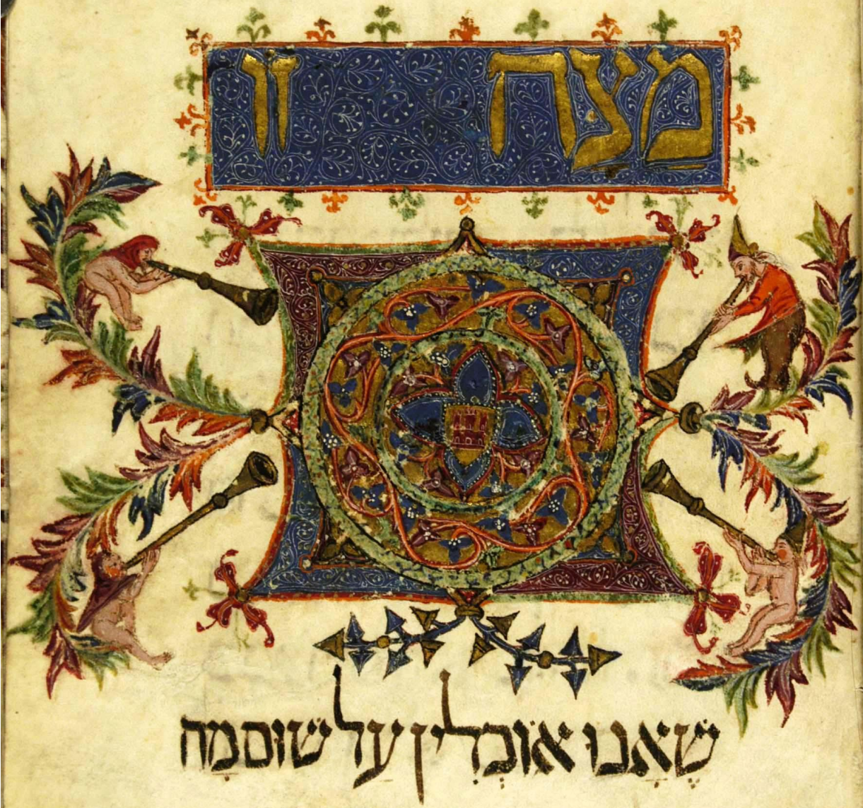
Агада Кауфмана, f.39r