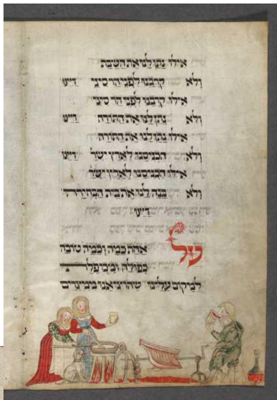
Вашингтонская агада, f.14v