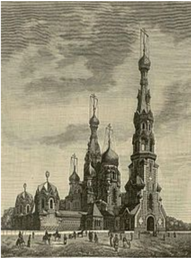
Рисунок будущего храма, выполненный архимандритом Игнатием , до доработки проекта архитектором Альфредом Парландом , 1883.