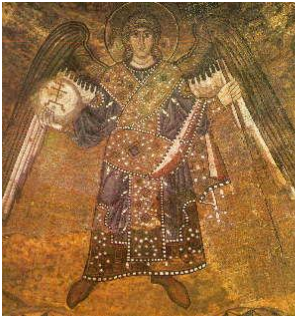
Мозаїка в центральному куполі – Архангел