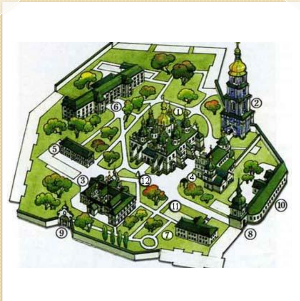
Схема Софійського монастиря